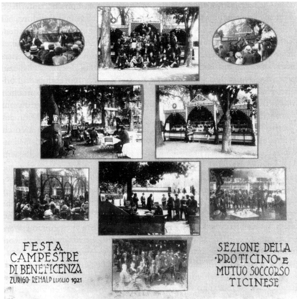
Abb. 4 Erinnerungstafel an ein Wohlfahrtsfest 1921 des ersten Tessiner Vereins in Zürich.