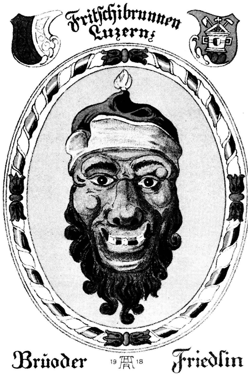
Abb. 2. Postkarte 1918 der Zunft zu Safran Luzern.