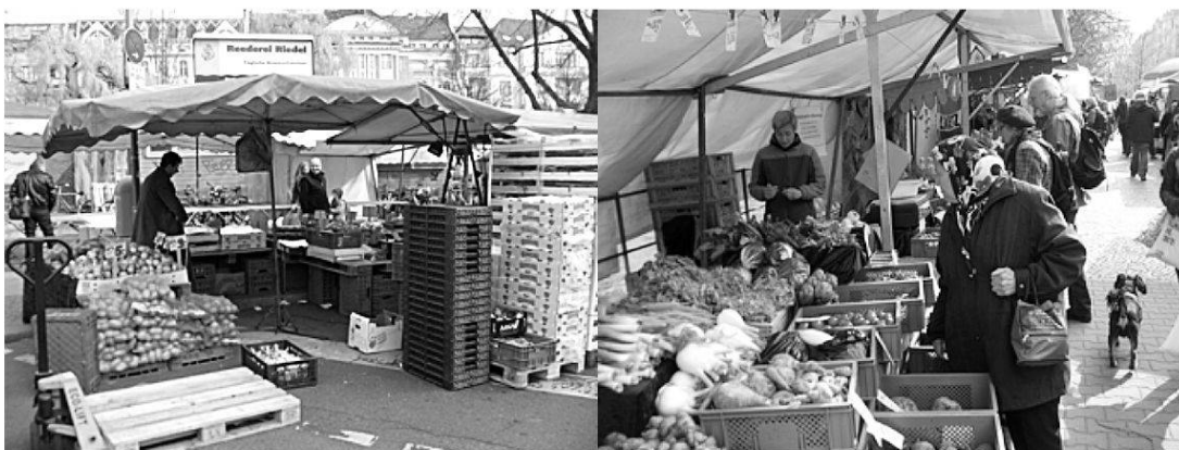
Abbildung 3: Türkischer und ökologisch-ausgerichteter Marktstand am Maybachufer

Diese Beschreibung der Raumstruktur trifft auf den BiOriental-Markt in gewisser Hinsicht zu, doch würde eine Reduktion dieses Marktabschnittes auf eine ethnisch geprägte Ökonomie wie in der Studie zur Keupstrasse in Köln (vgl. Yildiz, 2011) den vorhandenen Lebenswirklichkeiten im Stadtteil nicht gerecht