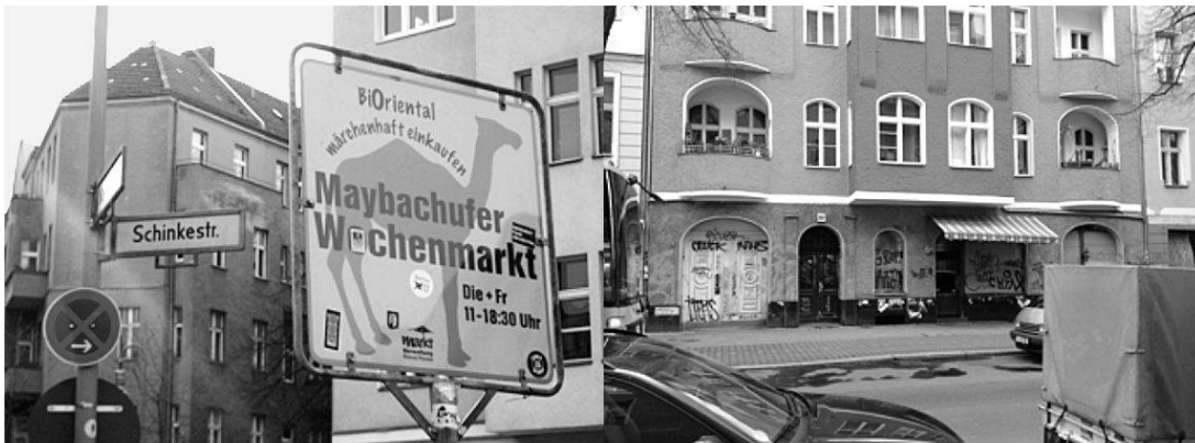
Abbildung 1: BiOriental-Marktschild am hinteren Marktende und die farbenfrohe Häuserreihe

«märchenhaft einkaufen» stehen dabei für eine Inszenierung der deutschen Vorstellung des Orients, die auf den beiden Marktschildern eine räumliche sowie zeitliche Verstetigung über die beiden Markttage hinaus erfährt. Die beiden Schilder definieren den Beginn und das Ende des Marktes und dadurch einmal mehr die räumliche Ausgestaltung der Insellage, die das Eintauchen in eine andere, fremde Welt erst ermöglicht.