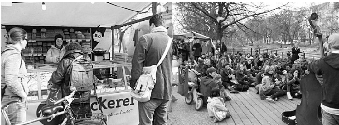
Abbildung 4: Ökologischer Marktstand und Musikinsel am unteren Marktende

nationale Studenten treffen auf junge Familien mit Kleinkindern, Neuköllns alt-ingesessene Bevölkerung beobachten das Markttreiben, Touristen wippen im Takt und lassen ihren Marktbesuch im wahrsten Sinne des Wortes ausklingen. 6