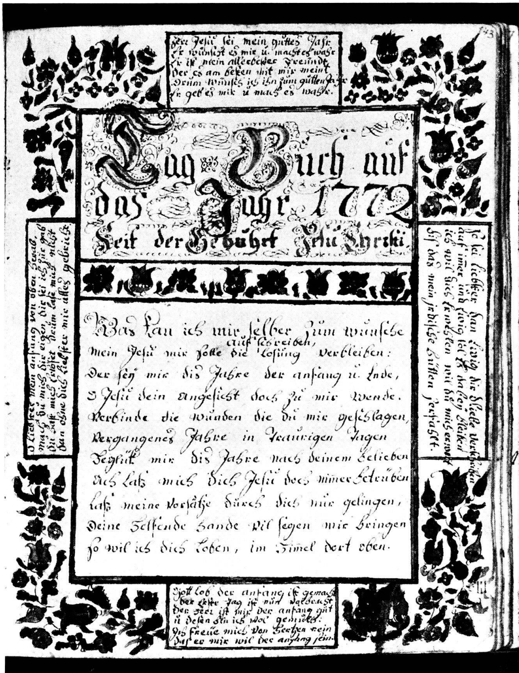
Abb. 2. Ulrich Bräker, Tagebuchtitel 1772, Feder/Tusche und Aquarell 20,8 × 16,8 cm. Stadtbibliothek Vadiana St. Gallen. Ms. 922. Seite 143.