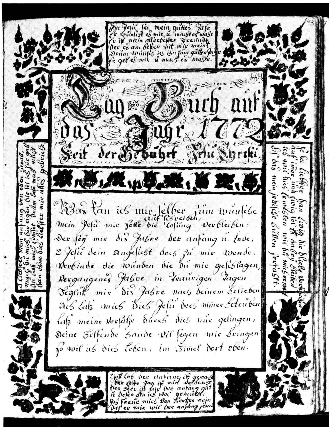
Abb. 2. Ulrich Bräker, Tagebuchtitel 1772, Feder/Tusche und Aquarell 20,8 × 16,8 cm. Stadtbibliothek Vadiana St. Gallen. Ms. 922. Seite 143.