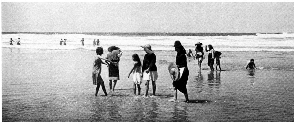
Abb. 1. Frauen und Kinder kommen aus dem Innern des Landes zum Bad am 29. August. Praia da Carrapateira.