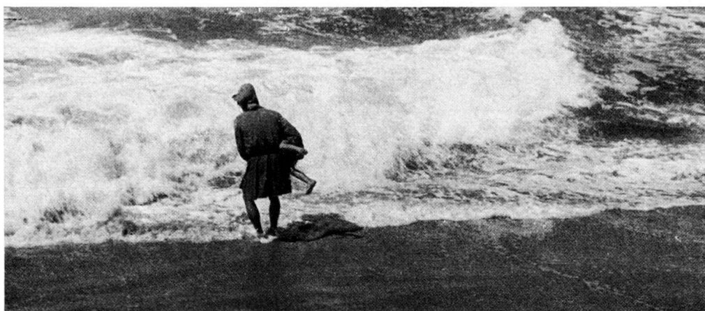
Abb. 2. Ein Tangfischer taucht ein Kind unter die heranrollende Welle. S. Bartolomeu do Mar, Espozende.