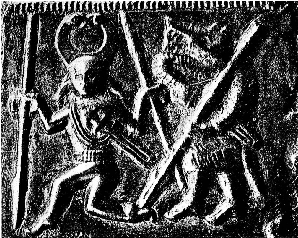
Abb. 1. Als Wolf verkleideter Krieger. Wikinger Kupferplatte aus dem 7. Jahrhundert. Aus: Gerald Simons, La naissance de l'Europe. Les Grandes époques de l'homme. Amsterdam 1970, 48.