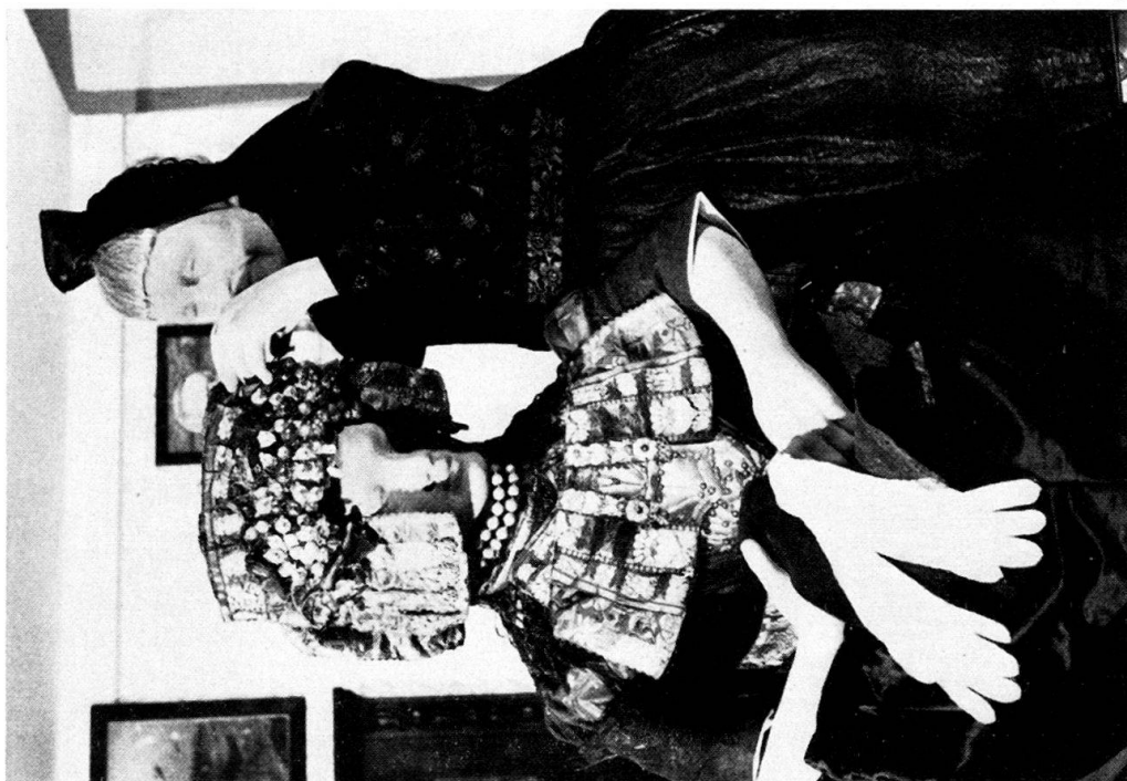
Abb. 2. Eine reiche Schwärmer Braut und die Schappelfrau.