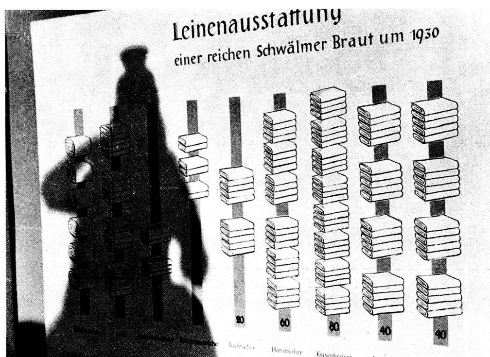
Abb. 3 und 4. Statistik der Leinenausstattung in der Ausstellung «Arm und Reich» des Universitätsmuseums Marburg.