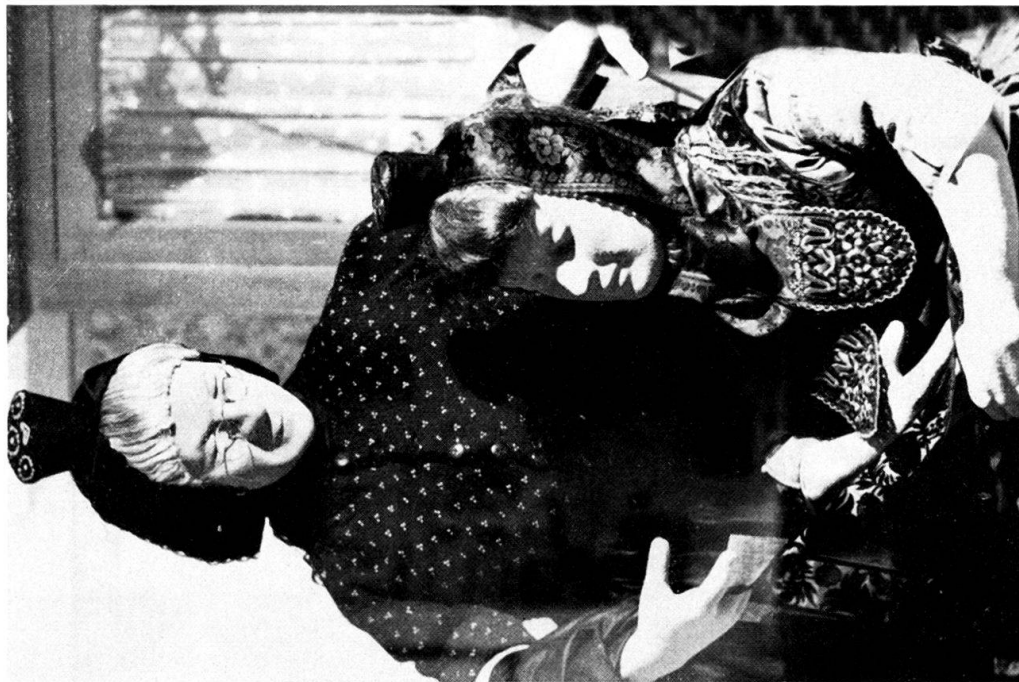
Abb. 1. Eine arme Schwärmer Braut und die Ankleiderin.