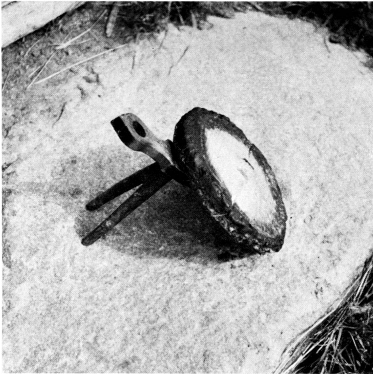
Abb. 3. Gestell aus Birke zum Backen von Käse. Die Platte konnte um eine in der Mitte befindliche Nabe gedreht werden. Auch in der Hitze gab das Birkenholz keinen Geschmack an den Käse ab. Lappajärvi, Südostbottnien. Photo Irma Vilkuna 1965.