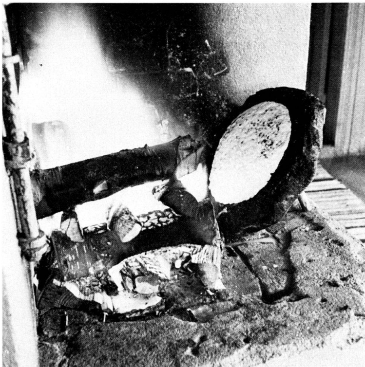
Abb. 2. Käse wird am offenen Feuer gegrillt. Zur westfinnischen Bauernstube gehörte ein offener Herd, durch dessen brennendes Feuer der Wohnraum sowohl geheizt als auch beleuchtet wurde. Veteli 1939.