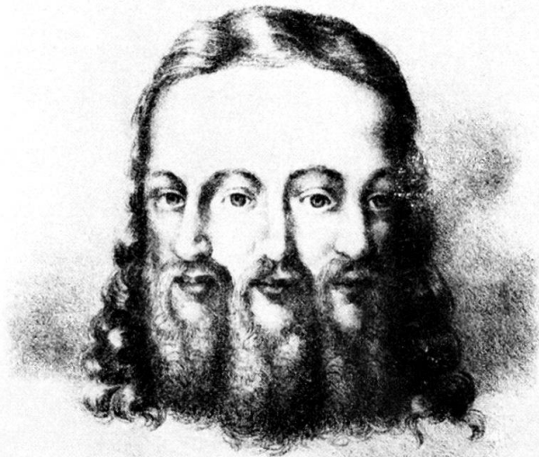
Abb. 3. Die heilige Dreifaltigkeit. Lithographie von E. Lemaître, Strasbourg, 1851. Arch. Dépt. Bas-Rhin, T. 44.