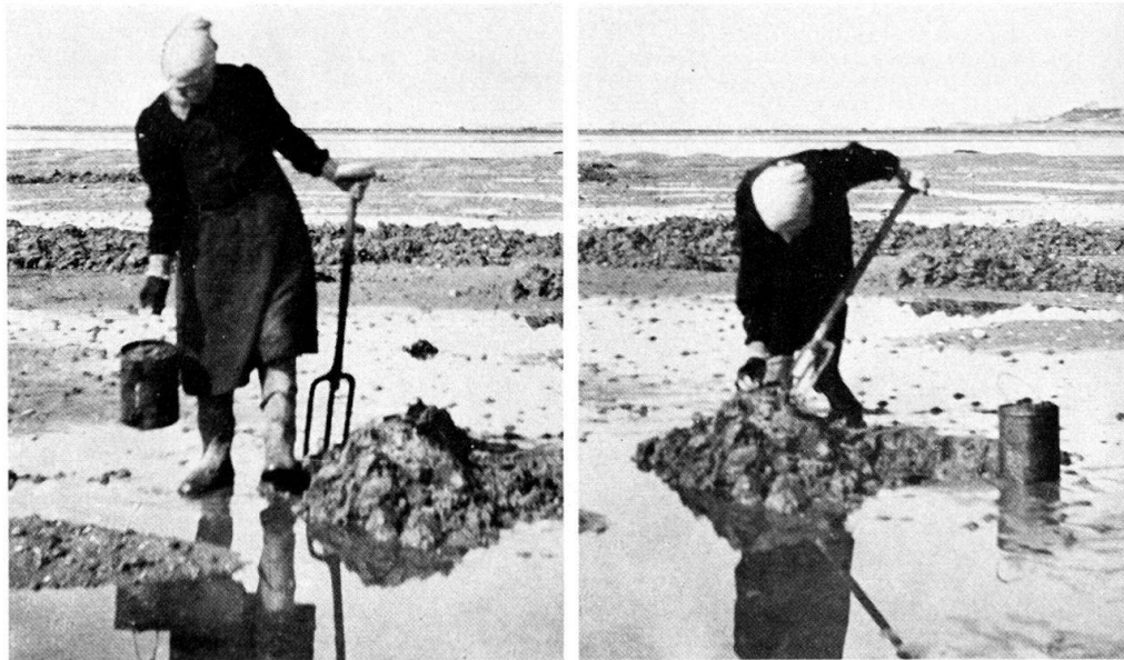
Fig. 1. Digging lug worm on the sea-shore north of Esbjerg, Jutland. The pictures show the heavy fork, length about 140 cm., and a bucket for holding the worms, instead of the old-fashioned wooden box. Behind the digger is seen an orme-groft (worm-ditch).