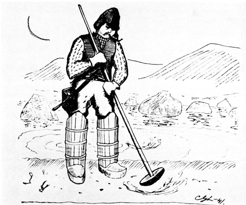
Fig. 2. Fisherman pounding lug worm. Drawing by C. G. Lekholm 1941. In his belt the man is carrying a comb for collecting worms, and he has a wooden box for holding them. He wears boots of a special construction on his feet (cf. note 7).