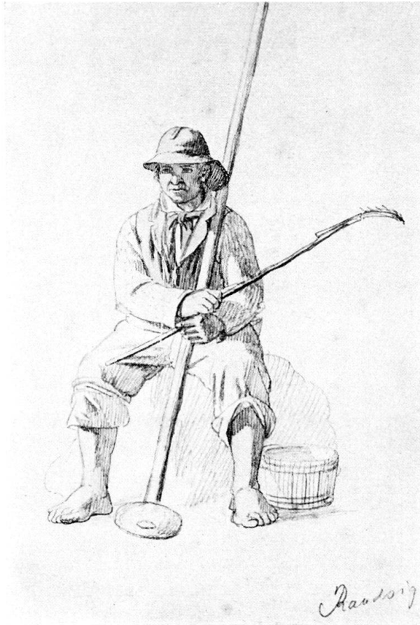
Fig. 3. Danish fisherman with his equipment for pounding lug worm. Drawing by Johan Peter Raadsig, possibly from Hornbæk, Zealand, about 1850. The equipment consists of rammer, comb and wooden tub.