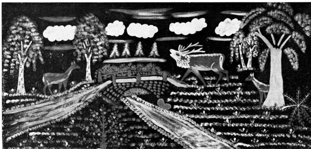
Abb. 6. Die Hirsche. Gemalt auf schwarzem Satin von Klara Kuchta aus Dąbrowka bei Stargard (Danzig). 80 × 162 cm.