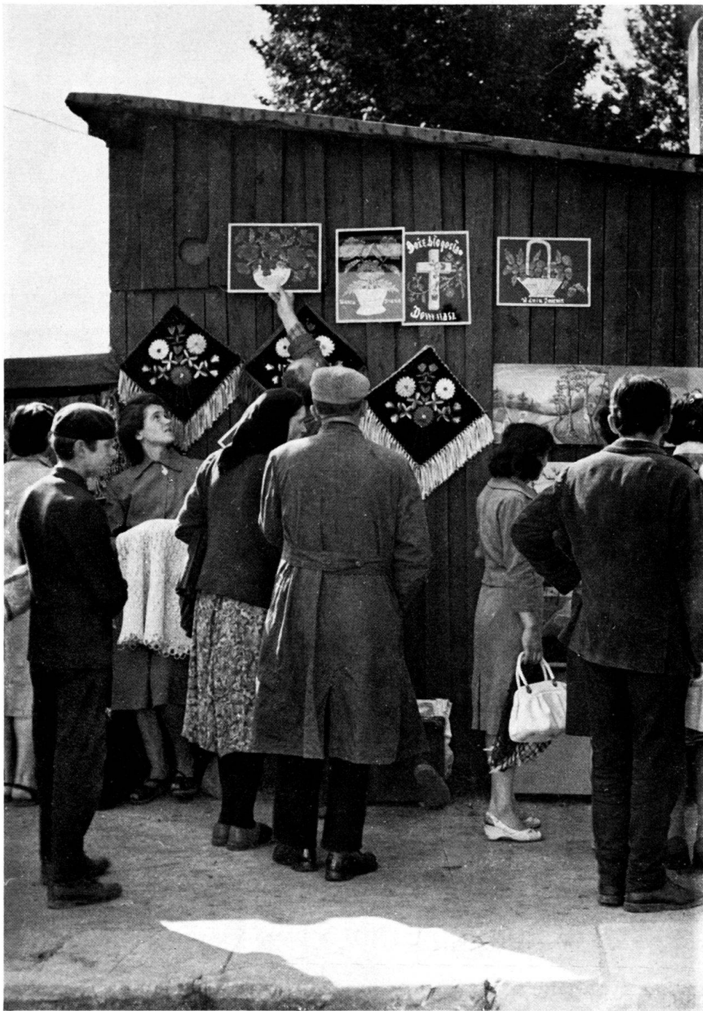
Abb. 1. Ein Jahrmarkt in Radomsko. Ein Stand mit Bildern.