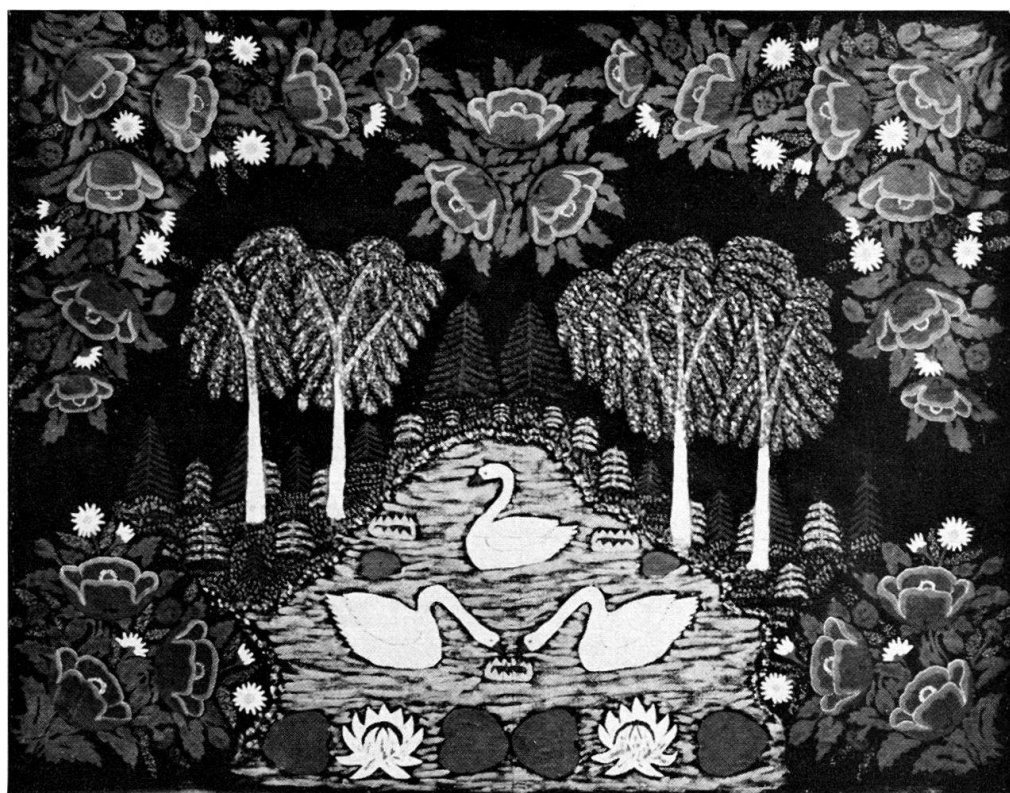
Abb. 5. Die Schwäne. Gemalt auf Leinwand von Jan Durko im Jahre 1958. Dorf Majdan bei Chelm. 140 × 180 cm.