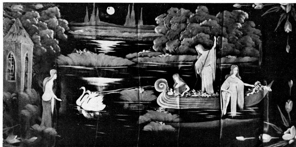
Abb. 8. Zauberlandschaft. Gemalt auf Satin, anonym, gekauft in Pommern.