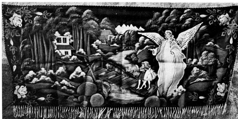
Abb. 7. Der Schutzengel. Anonym, gemalt auf Satin in Łódź, gekauft in Pommern.