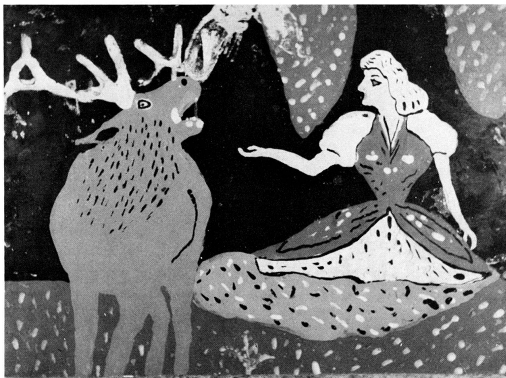
Abb. 4. Die Jungfrau und der Hirsch. Anonym, gekauft in Ochoża bei Chelm am Bug. Hinterglasmalerei, 27 × 37,5 cm.