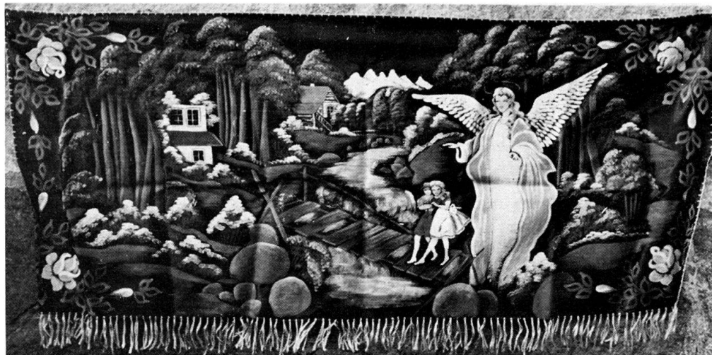
Abb. 7. Der Schutzengel. Anonym, gemalt auf Satin in Łódź, gekauft in Pommern.