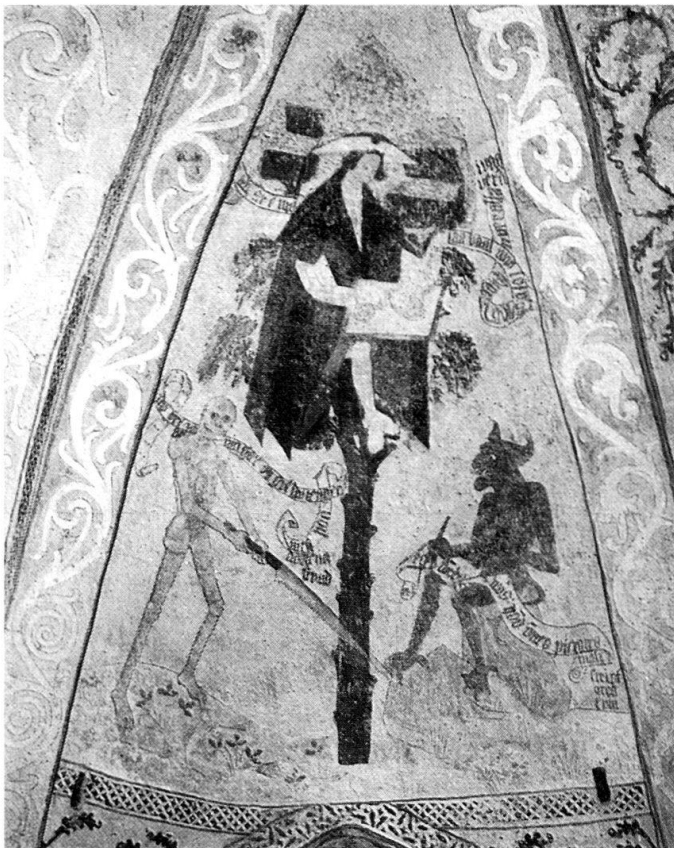
Abb. 2. Der Mann im Baum. Kirche zu Tensta (Uppland, Schweden).