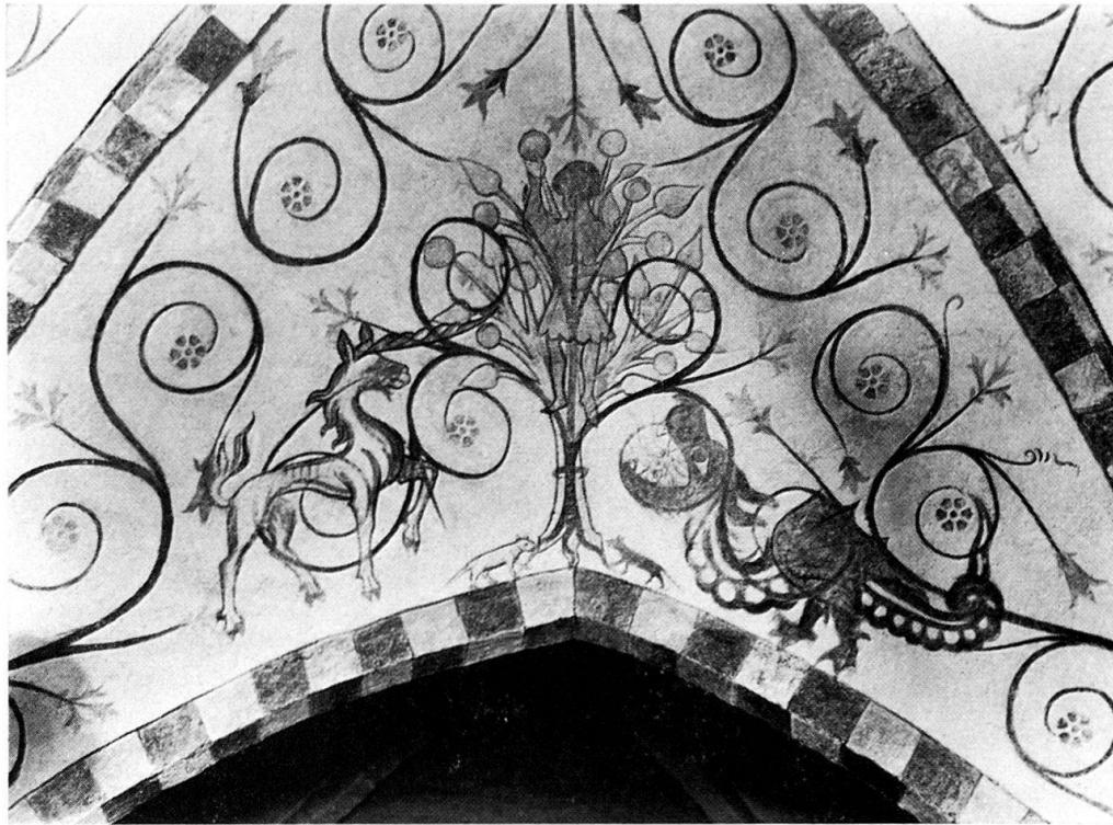
Abb. 1. Der Mann im Baum. Kirche zu Vester Broby (Sjælland, Dänemark).