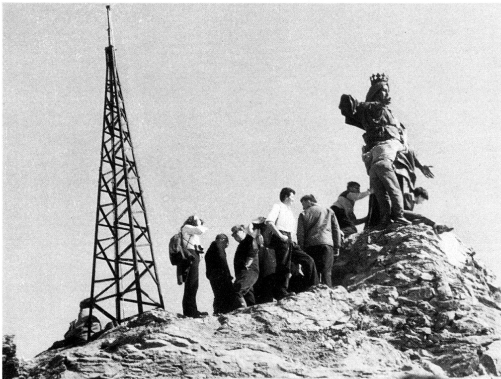
Abb. 6. Auf dem Gipfel des Rocciamelone. Marienstatue und Blitzableiter.