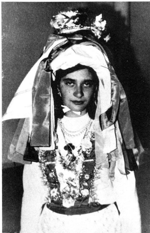
Abb. 3. Dasselbe, mit enthültem Gesicht.