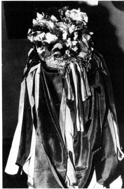
Abb. 2. Dasselbe, Hinteransicht.