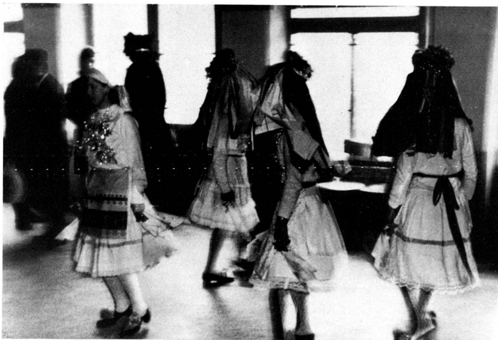
Abb. 4. Tanz der « máškare » aus dem Resia-Tal: vier mit verhüllten Gesichtern (die vierte wird von den zwei mittleren verdeckt), das fünfte Mädchen (ohne Kopfmaskierung, links) tanzt mit.