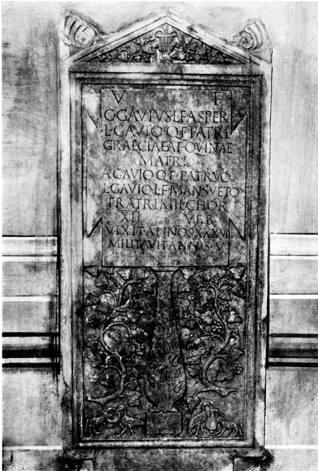
Abb. 2. Relief-Grabstein der Familie der Gabii, 1. Jh. n. Ch. zu Empoli bei Florenz.