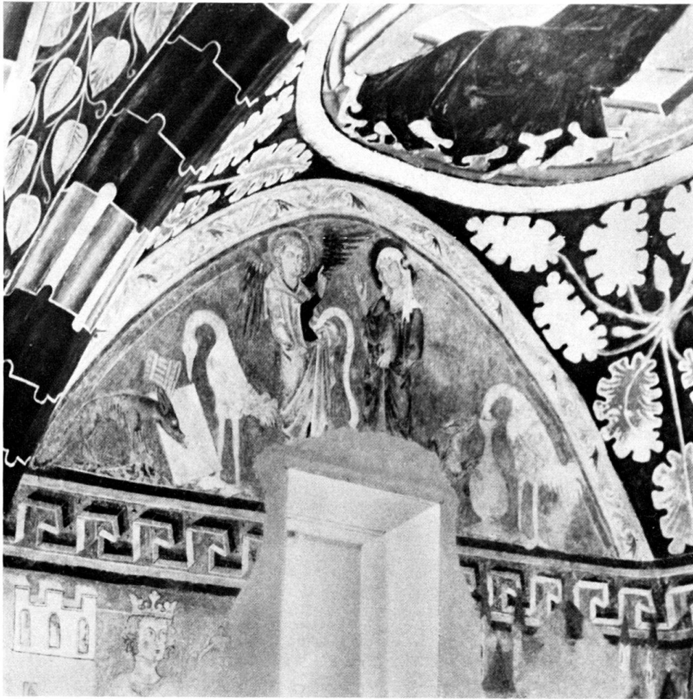
Abb. 1. Chorwandfresko: Maria Verkündigung und Phädrus-Äsop-Fabel vom Fuchs und vom Storch (Kranich), 14. Jh., Kirche St. Georg in Rhäzüns bei Chur, Graubünden. Neg.-Nr. 5840.