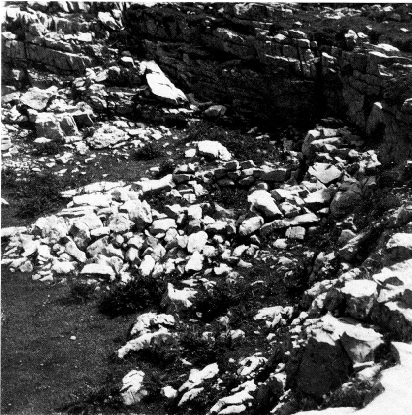
Abb. 3 Dieses Haus nützte die geschützte Lage unterhalb einer Schichtstufe aus. Muotathal SZ, Charetalp, «z'hin- derscht uff dr Alp», ca. 1880 m.