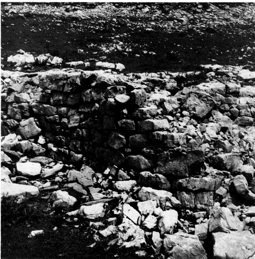
Abb. 4 Reste einer sorgfältig aufge- bauten Trocken- mauer. Muotathal SZ, Charetalp, Graben, 1858 m.