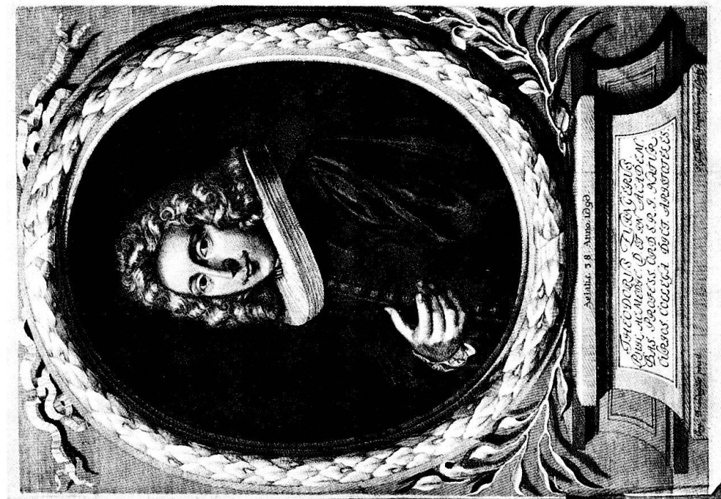
Abb. 1 Theodor Zwinger, 1658–1724. Porträt aus: «Theatrum botanicum, das ist neu vollkommenes Kräuter-Buch». Basel 1696.