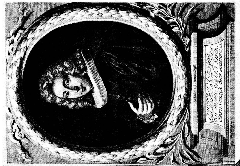
Abb. 1 Theodor Zwinger, 1658-1724. Porträt aus: «Theatrum botanicum, das ist neu vollkommnes Kräuter-Buch». Basel 1696.