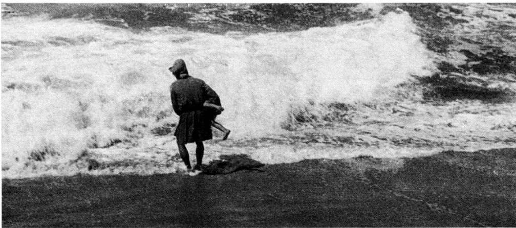
Abb. 2. Ein Tangfischer taucht ein Kind unter die heranrollende Welle. S. Bartolomeu do Mar, Espozende.