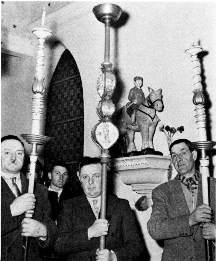
Fig. 2. Porteurs de torques.