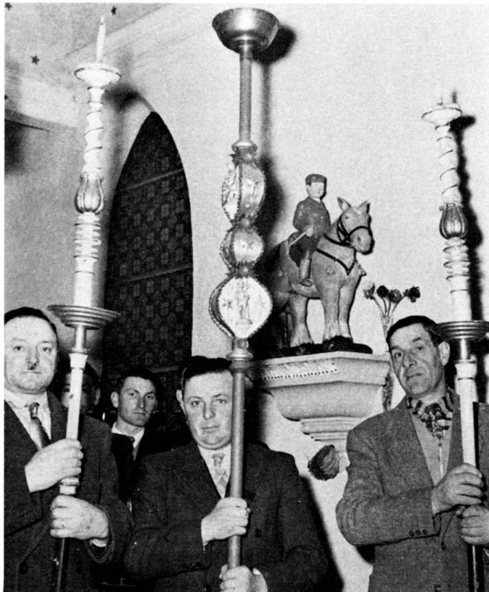
Fig. 2. Porteurs de torques .