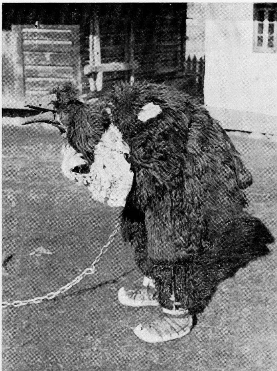
3 Bärenmaske aus dem Gebiet von Suceava, gebraucht an Neujahr.