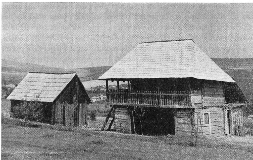
Fig. 4. Constructions du secteur des presses à huile.