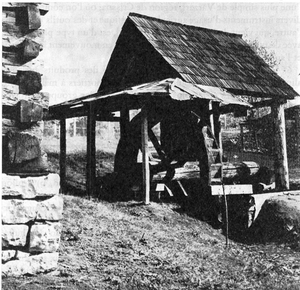
Fig. 5. Installation pour broyer les minerais aurifères des Monts Apuseni.