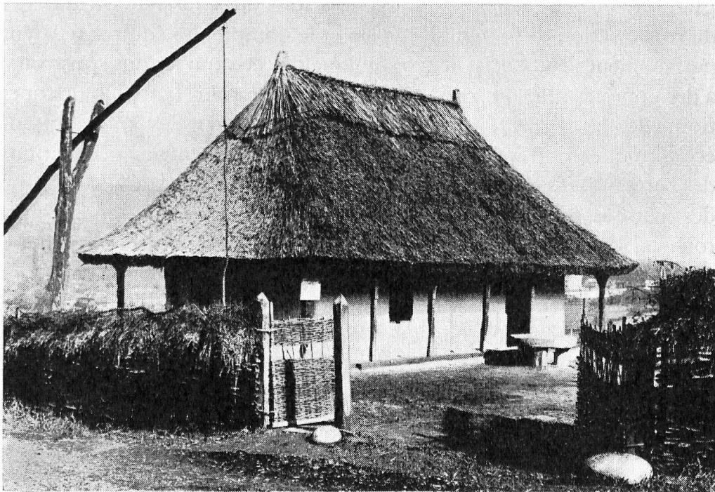
Fig. 2. Maison de «lâmpia Transilvaniei».