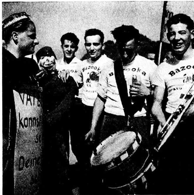
Abb. 2. Einige Näfeler Rekruten. Man beachte von links nach rechts den Rekruten mit der Blechbüchse als Kopfbedeckung und dem umgehängten Kartonschild, die Stroh- puppe, auf die er sich mit dem Ellbogen stützt, die «Bazooka»-Hemden der vier andern Rekruten und die «Musik»- Instrumente.

nismus gehören sie auf keinen Fall zur Tradition, aber das wird auch gar nicht verlangt. Sieben Rekruten, darunter die 'Musikanten', zogen solche Hemden an; die einen trugen die Zeichnung vorn, die anderen auf dem Rücken. Der Leiter des Zuges schwang eine buntbemalte Blechbüchse mit Glöckchen daran hin und her. Dieses Instrument diente ihm gleichzeitig als Kopfbedeckung 57 . Ihm folgt die 'Musik'. So marschierten die Rekruten in ziemlich lockerer Ordnung durch Glarus hindurch, jedoch ohne den Verkehr bewusst zu stören. Dabei trieben sie allerhand Ulk, stimmten Soldaten- und Volkslieder an, die sie mehr johlten als sangen. Sie standen zu jener Zeit noch keineswegs unter alkoholischem Einfluss; die Dummheiten, die sie trieben, waren lediglich Ausdruck jugendlichen Übermuts. Während des Durchmarsches durch Glarus kamen noch weitere Elemente hinzu: So wurden rote Ballons mit Aufschriften, wahrscheinlich Reklameware, aufgeblasen, während einer als 'Vormarsch' mit seiner Mappe an einem Stock herumstolzierte.