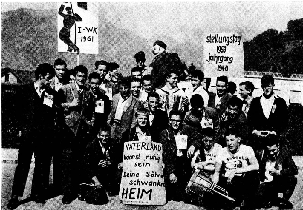
Abb. 1. Näfels Rekrutenjahrgang 1940. Zu beachten sind die Schilder und die Strohpuppe im Hintergrund.

sondere Bräuche besonders gekennzeichnet werden, sind sie hier weder hervorgehoben noch schlechter gestellt, im Gegenteil: Während sie im Waadtland ein weisses Bündelchen tragen, in Chur am Ende des Zuges einhergehen, im Solothurnischen je einen Doppelliter 'blechen' müssen 44 , so werden sie in Glarus, wenn überhaupt abgesondert, von ihren Kollegen sehr wohlwollend behandelt. Man schenkt ihnen ein Abzeichen und tröstet sie.