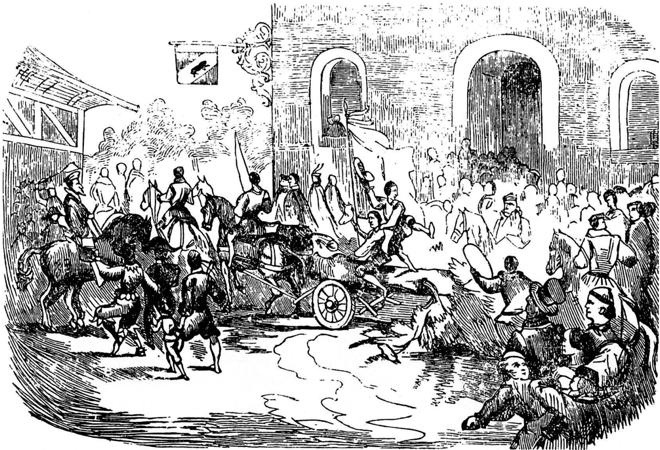
Die Tannenfuhr zu Seedorf (links Gessler zu Pferd, davor zwei Narren und Tell mit seinem Knaben). Vgl. S. 34

nehmer des dramatischen Volksschauspiels. Schon letzten Frühling hatten Arbeiter in einem benachbarten Bezirke ... eine ähnliche Aufführung unternommen.» Bemerkenswert, dass trotz einer so «modernen» Spielgemeinschaft die Rolle der Bertha von einem «jungen Färbergesellen» besetzt war 29 . Die meisten Szenen stellte man auf dem Dorfplatze dar: Unter der Dorflinde redete Gertrud ihrem Manne zu; Walter Fürst empfing ihn auf der Treppe vor einem Fabrikantenhause. Für den Rütlichswur war eine «Brügi in offener Wiese» errichtet worden. «Am östlichen Eingang des Dorfes» wurde schliesslich «die hohle Gasse improvisiert». Dorthin «ergoß sich» nach dem Apfelschuß «der Menschenstrom ..., mitten drinnen Geßlers Schar; aber plötzlich ... war ihm Tell ohne Tellenplattensprung abhanden gekommen.» Tell erwartete seinen Widersacher auf einem «Haufen Bauholz». Eine Woche später 30 wiederholte man das Schauspiel «weiter oben im Lande».