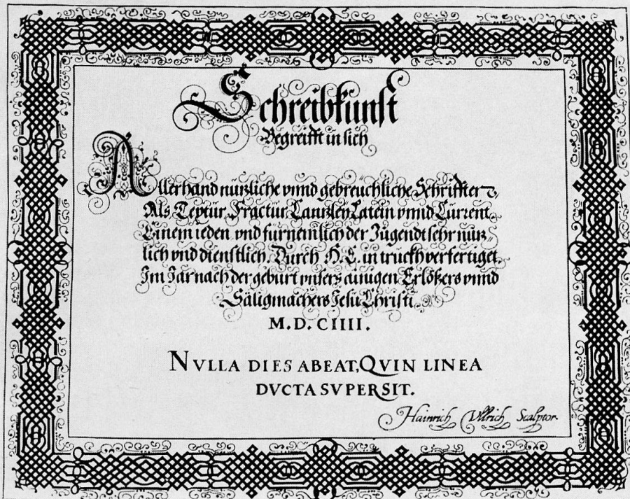
Abb. 1, Heinrich Ulrich, Stich, 1604