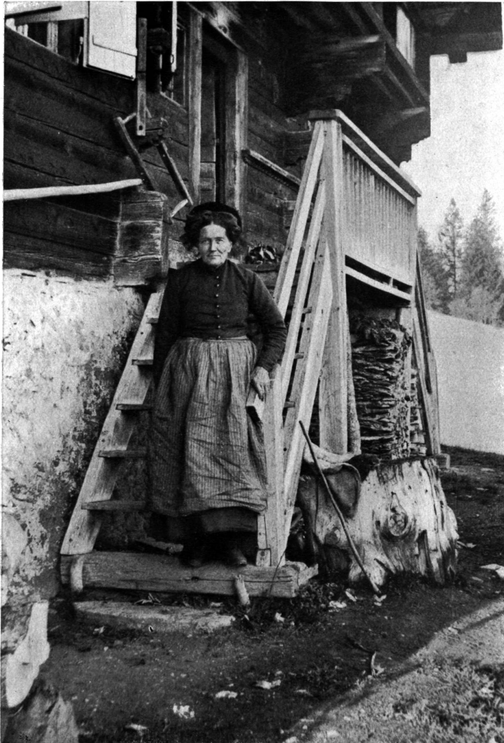
Une vieille femme devant son escalier de bois, au Pays-d'Enhaut romand.