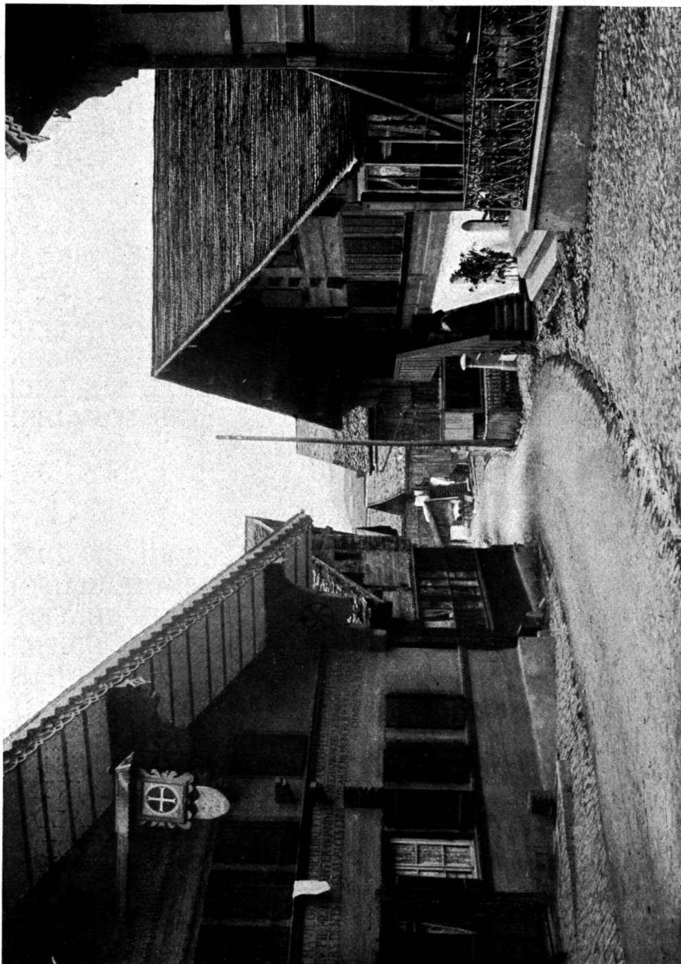
Fig. 16. A Rougemont. Ancienne auberge de la « Croix-Blanche ». 1762.