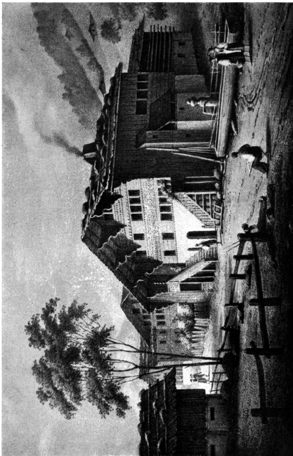
Fig. 17. Rougemont. Aux Allamans. 1767. Vue de la pension des Mélèzes, vers 1820. (Voir page 122.)