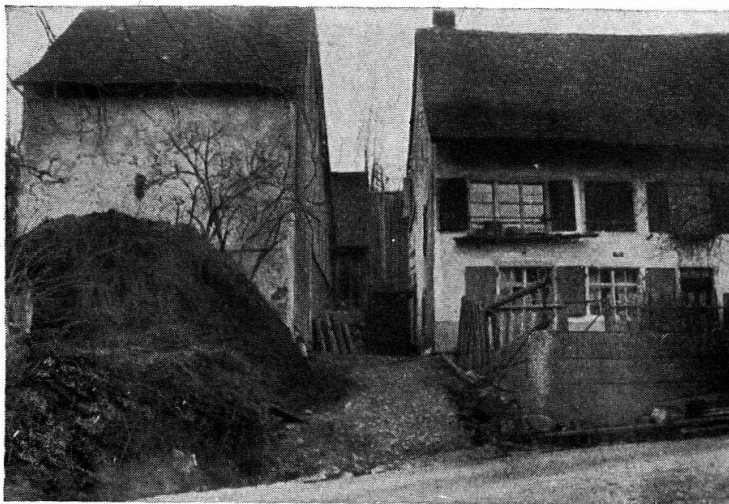
3. Bild. Haus mit freistehenden Bienenkörben. Wohn- und Wirtschaftsgebäude ausnahmsw. getrennt. 1. Düngerhaufen, r. Hausgarten mit Lattenhag. Betr. Lokalität vgl. 2. Bild.