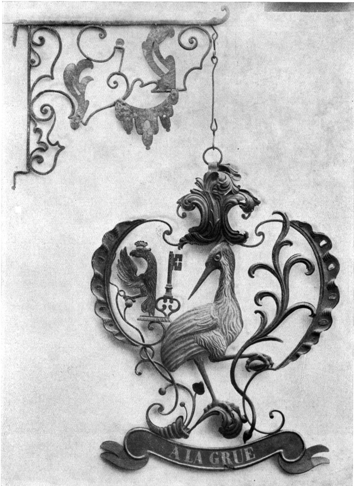
Fig. 1. La Grue