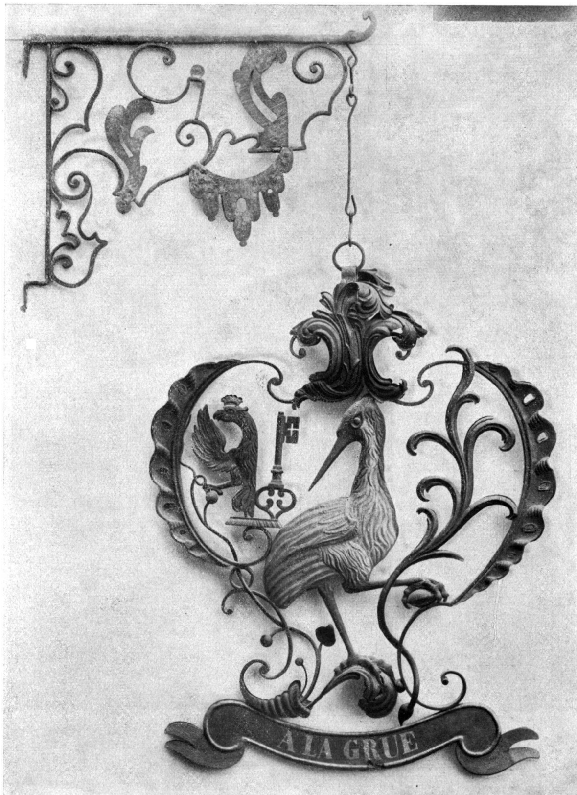
Fig. 1. La Grue