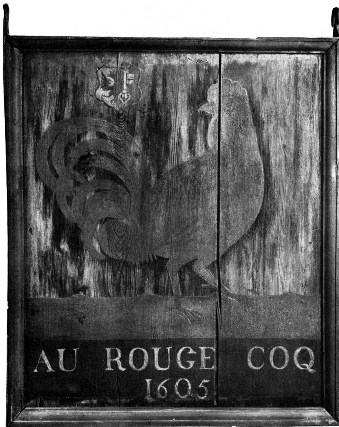
Fig. 2. Le Rouge Coq