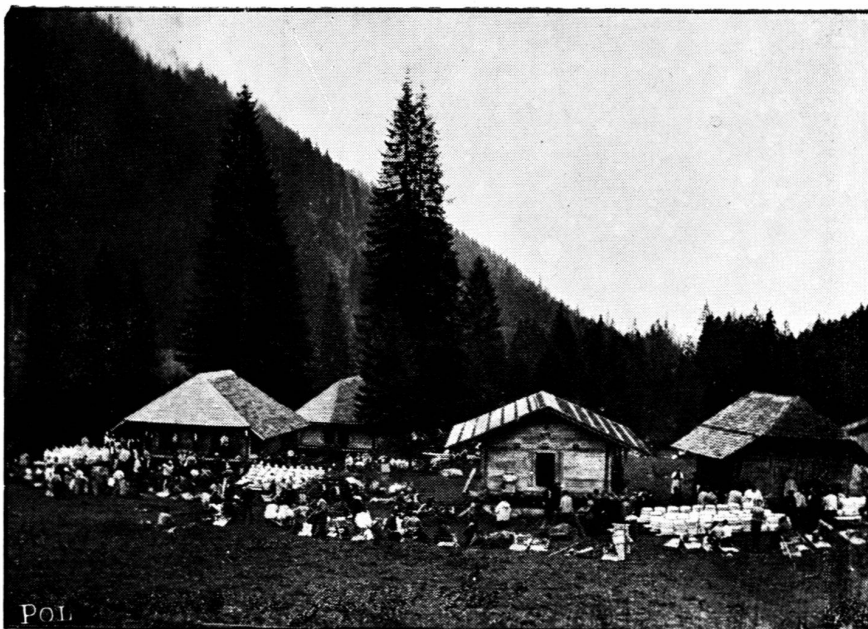
Kästeilet im Justital.