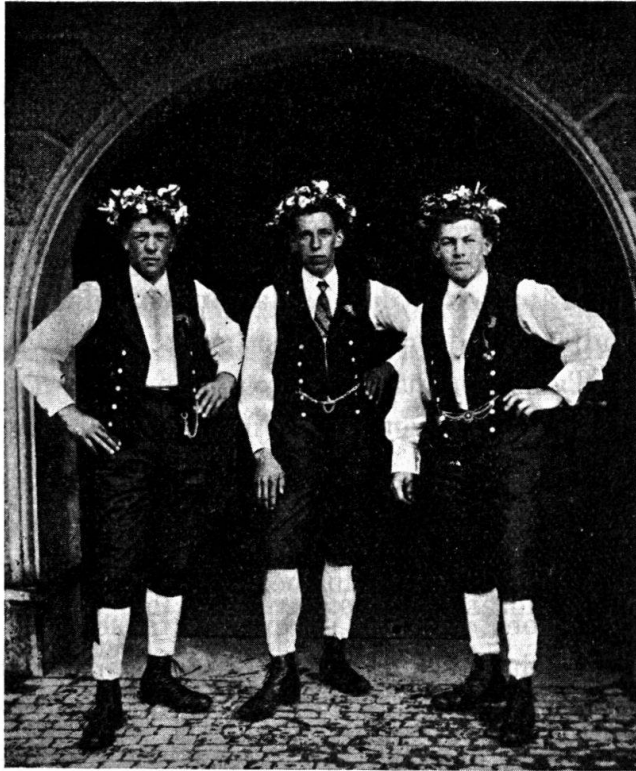
Tanzschenker im Bez. Küsnacht am Rigi.

Im Kanton Schwyz und auch zum Teil in den andern Urkantonen hat sich die Sitte des sogenannten „Rästlitzens“ an den allgemeinen öffentlichen Tanztagen erhalten. Eine „Rast“ nennt man kurze, rasch nacheinander folgende, jetzt gebräuchliche, gewöhnliche Tanzarten, wie Schottisch, Mazurka, Polka, Galopp und Walzer. 1) Es wird nun in den