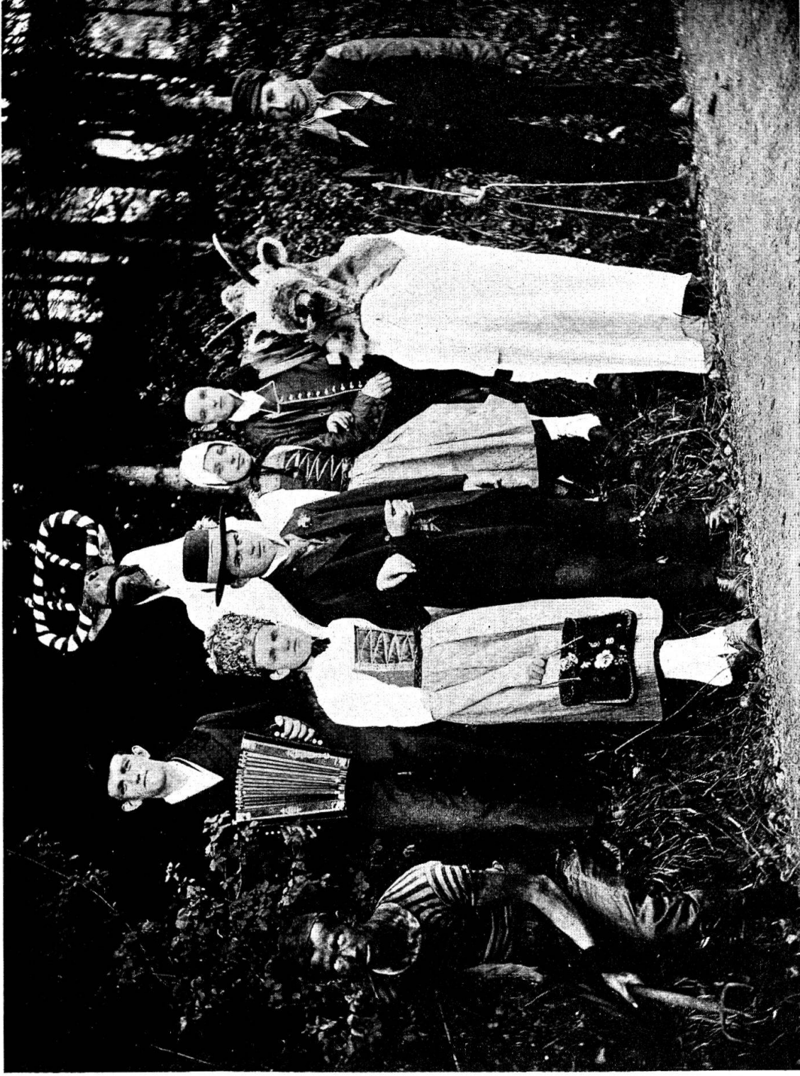
Spräggelengruppe mit zwei Schnabelgeissen aus Obfelden.