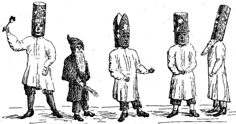
Illustr. 2: Typen von „Samichlausen“ in Glarus.

Nach der Natur gezeichnet von Dr. Ernst Buss.