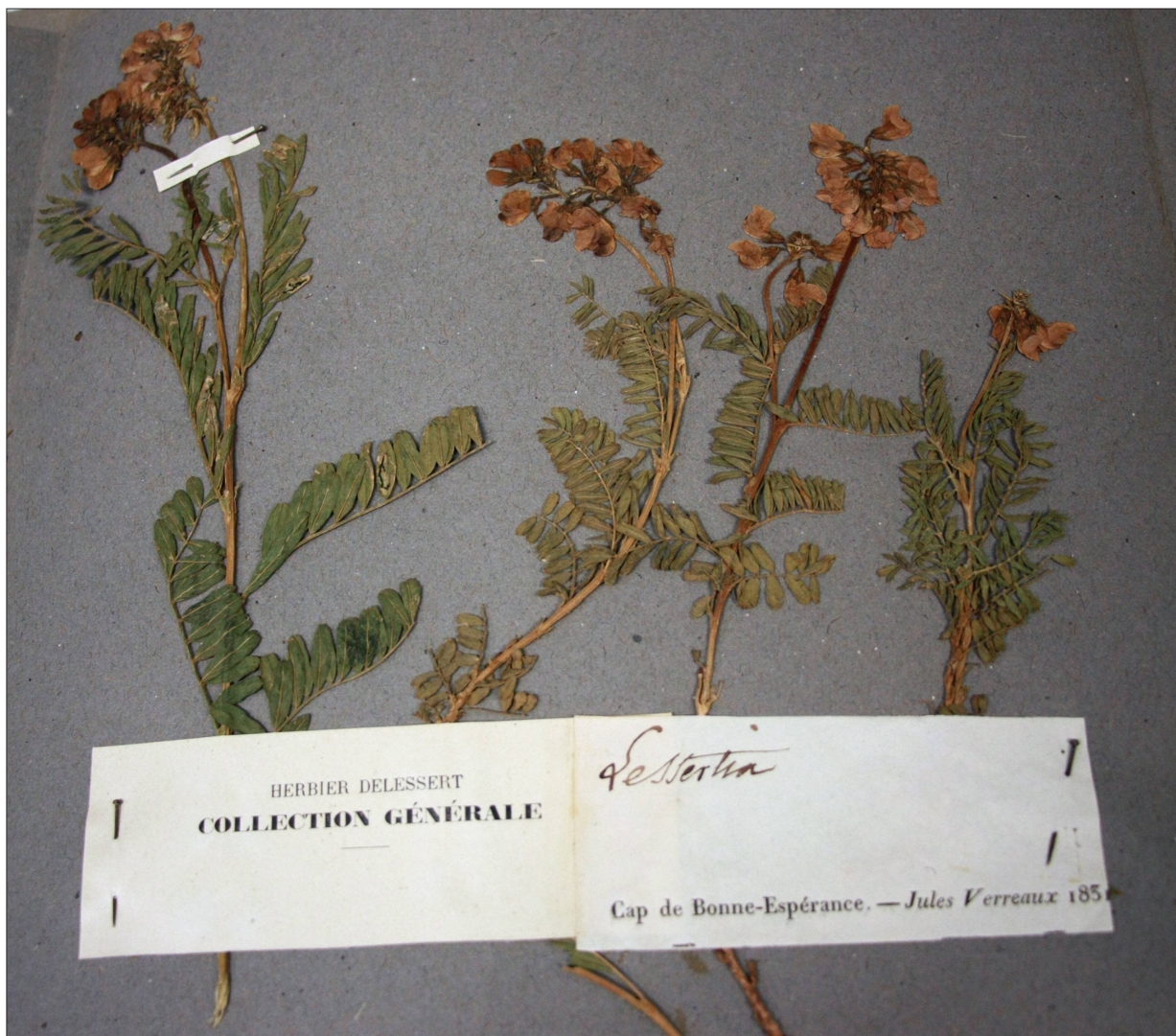
Fig. 10: Lessertia pulchra , collectée par le grand voyageur Jules Verreaux, prélevée du Cap de Bonne Espérance, en 1831. CJBG.

Il existe une autre salle qui héberge une collection de fruits et de graines; elle se dote d'armoires vitrées qui protègent les fruits de grande dimension, et de trois meubles à tiroirs pour les petites graines. Les noix sonores du Thevetia Ahouai jouxtent les fruits, aux silhouettes de pommes d'arrosoir, du Nebulo , symbole égyptien sacré. Les fruits presque coniques du Couratari Guyanensis toisent ceux du Phytelephas , dont les graines durcies, blanches et dures, se traitent en véritable ivoire végétal. C'est dans ce même endroit que logent divers objets de curiosité.