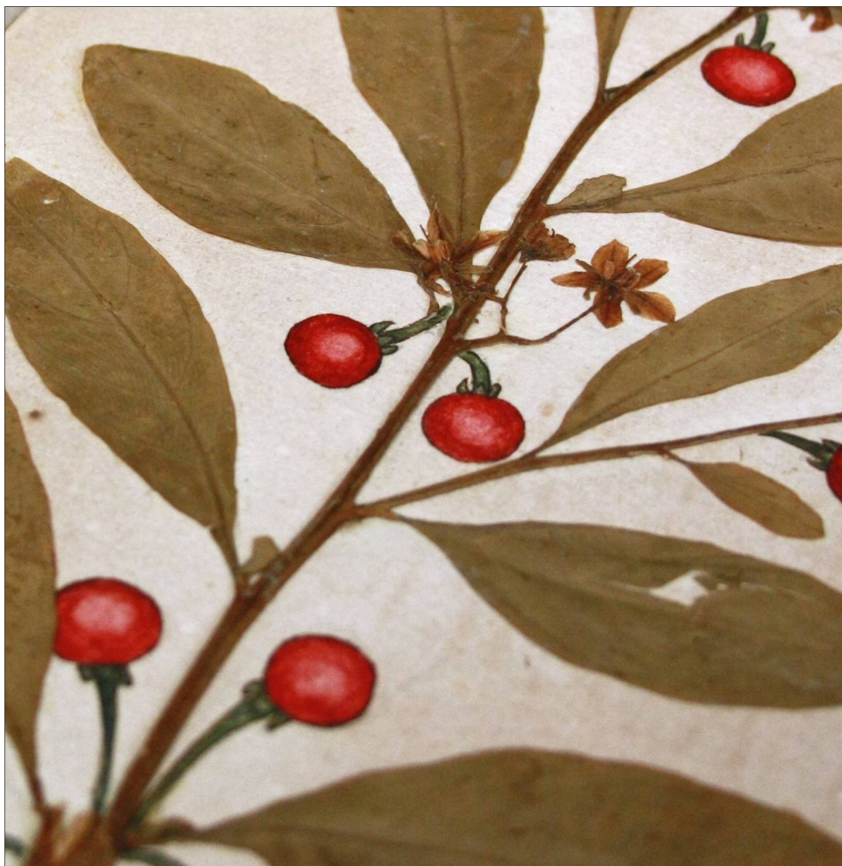
Fig. 12: Solanum pseudocapsicum , feuilles séchées et baies aquarellées, collection du catalan J. Quer. CJBG.

La parution du volume de Lasègue a pour premier effet d'apporter aux botanistes, de tout gabarit, un précis inédit dans les deux remarquables collections