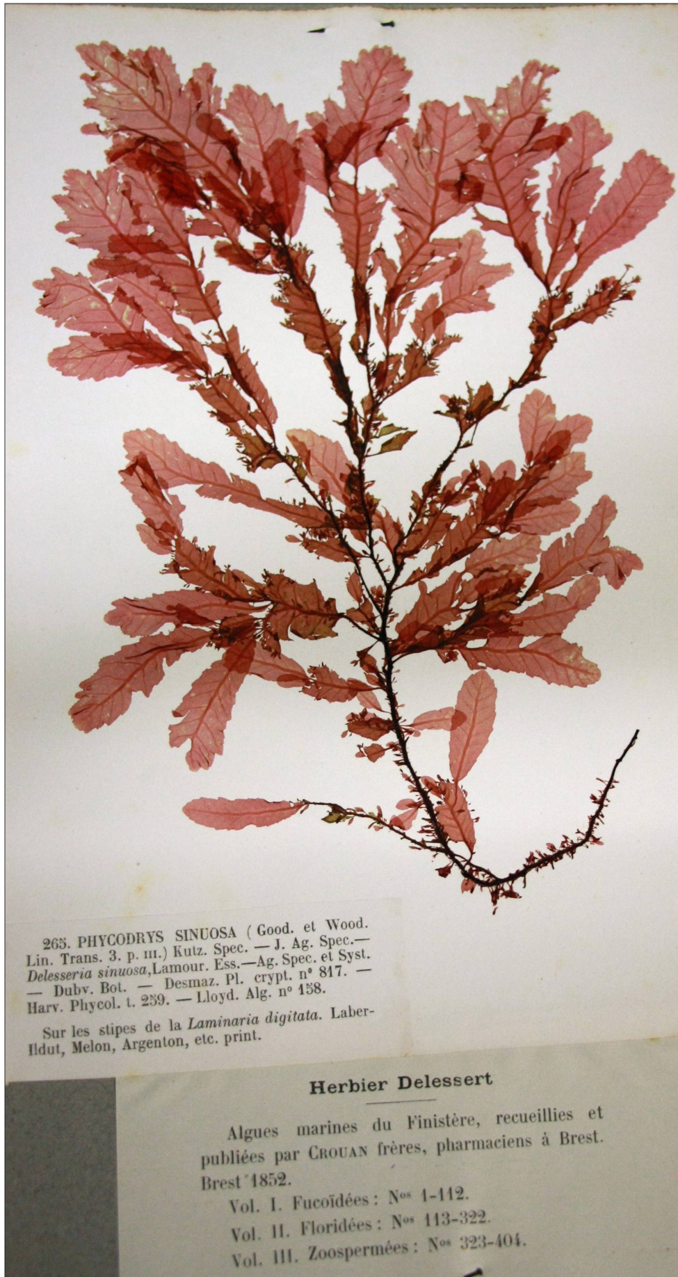
Fig. 9: Delesseria , récolte des célèbres frères Crouan. CJBG.