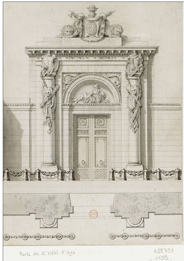
Fig. 7: Portail de l'Hôtel d'Uzès. BNF.

Désormais, non loin des locaux bancaires, plusieurs salles dédiées composent le musée spécifique. Le conservateur évoque « plusieurs galeries consacrées à l'herbier et disposées en même temps pour l'étude ». En 1845, il ne s'y trouve pas moins de 1750 boîtes, dans un espace d'importance, 1453 pour l'herbier général dont 1332 phanérogames et 121 cryptogames, et 201 pour les herbiers particuliers, 96 pour les cas doubles ou indéterminés. Les collections connaissent un prodigieux accroissement et atteignent 2 750 boîtes, lors du congrès de botanique d'août 1867, selon Eugène Fournier. Les magnifiques collections, acquises souvent à des prix faramineux, données généreusement parfois, se côtoient, prêtes à la consultation. Les planches rassemblent 250 000 échantillons, ordinaires ou rares, soit 86 000 espèces parmi celles identifiées alors dans le monde. Beaucoup d'herbiers enrichissent, les galeries dans lesquelles se superposent les boîtes de Louis Guillaume Lemonnier, de Commerson, des Burman, de René Louiche Desfontaines, de Raffeneau-Delile, de la Billardièrre, de Louis Bosc d'Antic, de Michaux, sans omettre les boîtes des herbiers de Palisot de Beauvois, de Ventenat, de Thuillier, supports remarquables, tous prisés par les