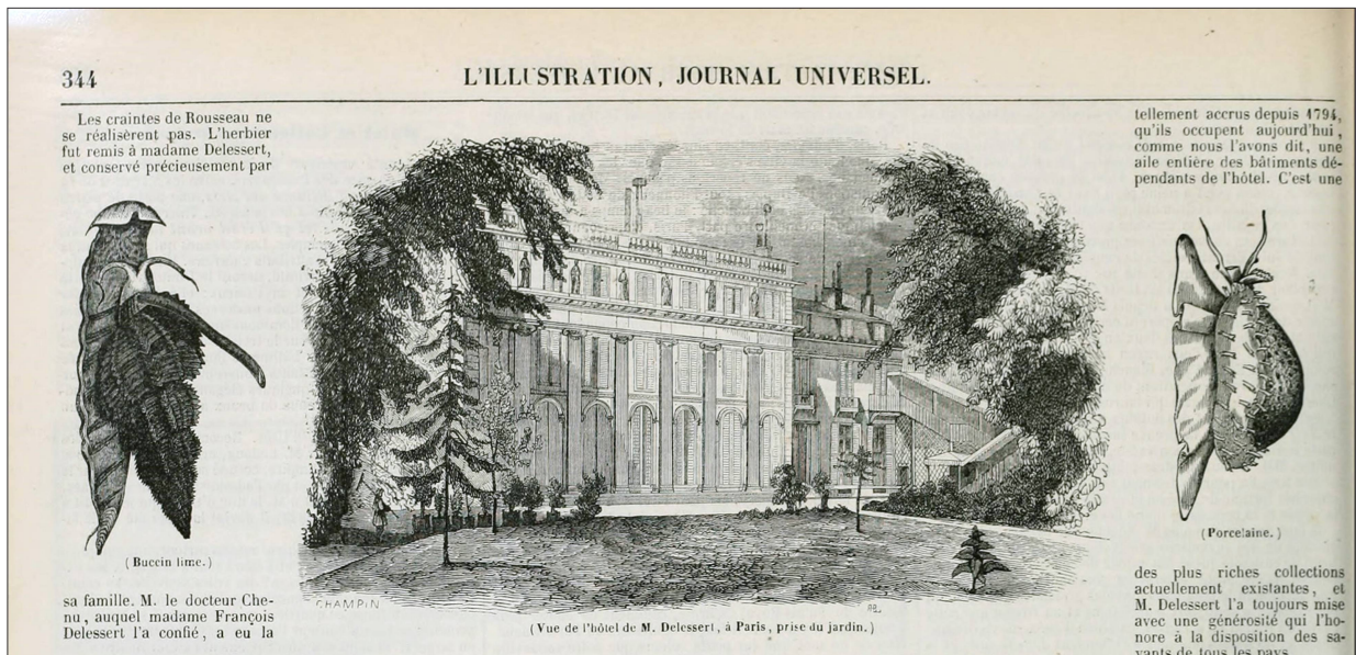
Fig. 8: Hôtel d'Uzès, façade sur jardin, « L'illustration ». (Collection particulière.)

La classification linnéenne, selon Sprengel, est observée, et un « catalogue manuscrit, séparé et tenu au courant renvoie aux genres qui ne sont pas dans le Systemus de Sprengel ». Delessert renonce à réordonner les herbiers en fonction de la méthode naturelle candollienne qu'il prône et soutient à fond.