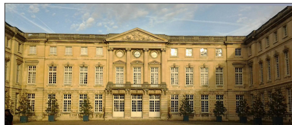
Fig. 3 : Cour d'honneur du château de Compiègne.