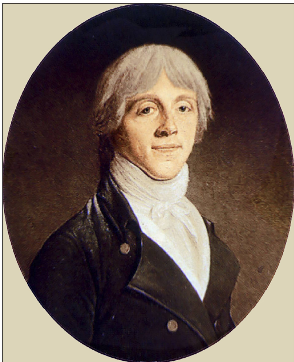
Fig. 6: Portrait de Benjamin Delessert.

la connaissance des langues, et avant tout, la maîtrise du latin, langue essentielle des botanistes.