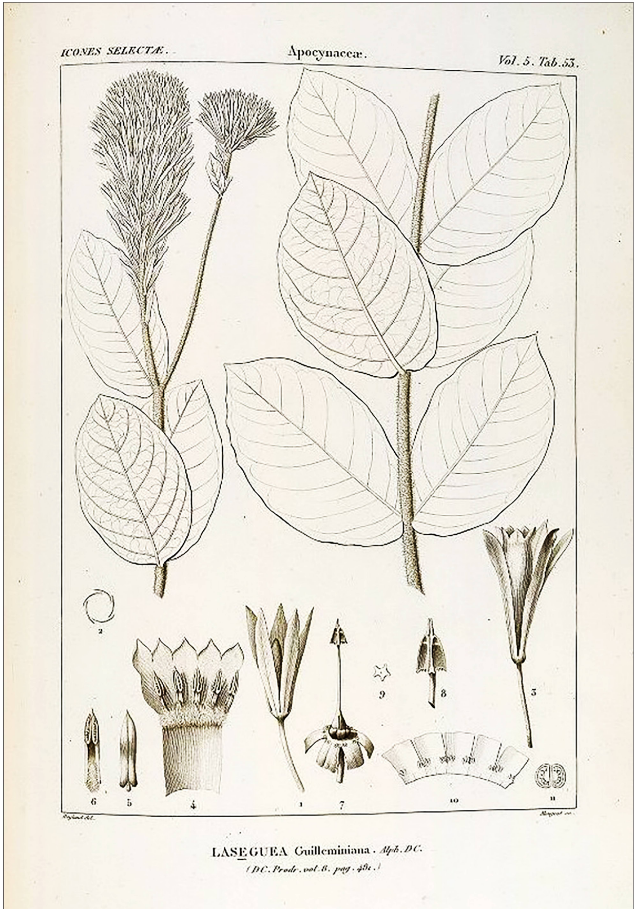
Fig. 11: Laseguea guilleminiana , in Icones selectae plantarum , vol. V, de Candolle, BHL.