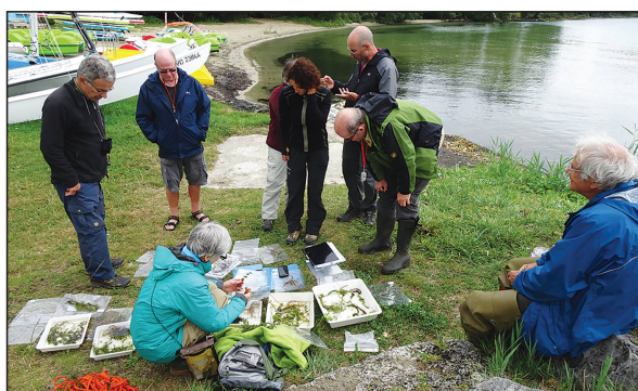
Travaux pratiques au bord du lac.

Texte : Patrick CHARLIER