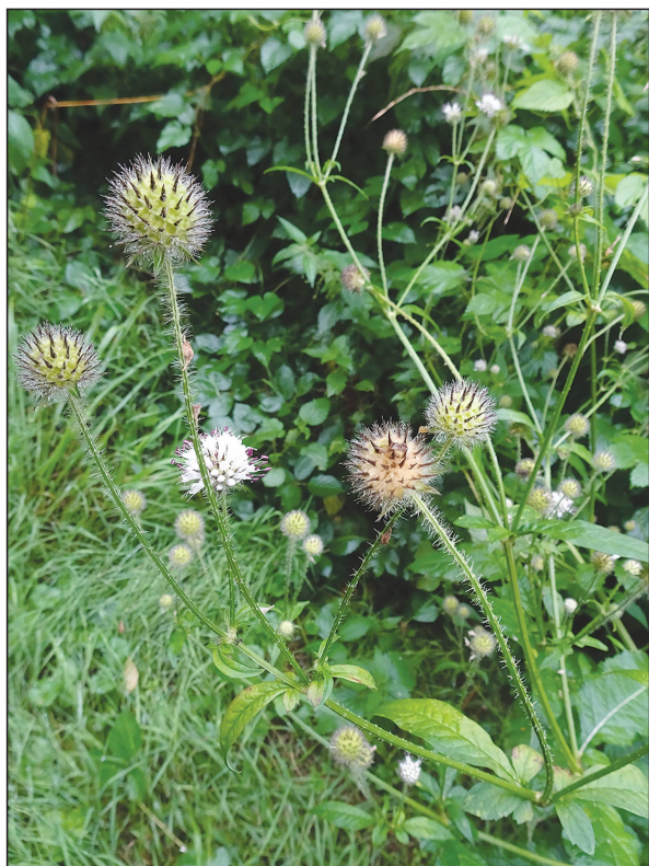
Dipsacus pilosus , plante.