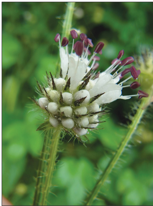
Dipsacus pilosus , fleur.