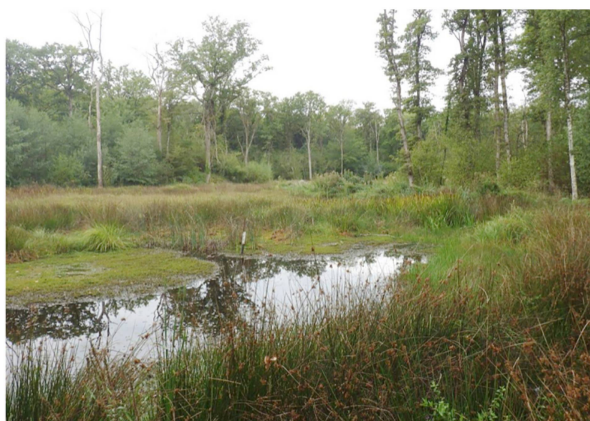
Figure 6 : Ludwigia ×kentiana E. J. Clement à Combes Chapuis, Versoix, Genève, où elle forme une colonie dense dans l'angle de l'étang, 22 septembre 2015.