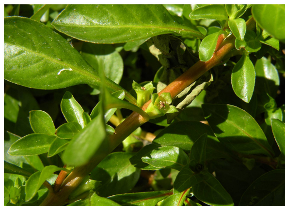
Figure 7 : fleurs de Ludwigia palustris (L.) Elliott, étangs de la Dombes, Ain, France, 1er août 2009. On distingue les bandes vertes qui ne sont pas encore très marquées.

L. palustris ne semble pas former de grandes colonies denses comme le fait L. ×kentiana (par exemple à Combes Chapuis, figure 5). Comme le préconise CLEMENT (2000), l'identité du taxon devrait donc être vérifiée dans des sites hébergeant de telles colonies.