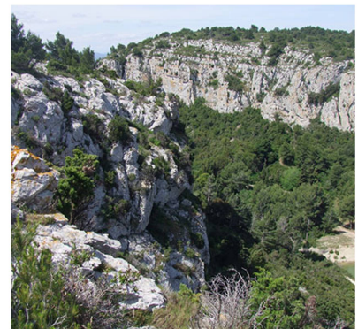
Bord du plateau de la Clape