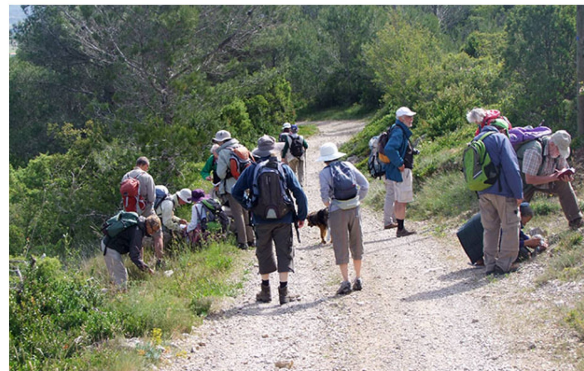
Chemin des Crêtes

Salvia verbenaca Sanguisorba minor Santolina chamaecyparissus Scabiosa maritima (= Sixalix atropurpurea subsp. maritima ) Sedum sediforme Senecio inaequidens Silene italica Staezelina dubia Thymelaea sanamunda Thymus vulgaris Trifolium angustifolium Trifolium campestre Trifolium stellatum Urospermum dalechampii Vicia sp. Vincetoxicum hirundinaria Vitis vinifera