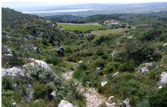
Plateau de la Clape au-dessus de Pech Redon

On poursuit sur la Route bleue jusqu'à l'intersection des routes Narbonne / Gruissan. Direction Narbonne, puis première route à droite (c'est le chemin de la Coulevre) en direction des Châteaux de Figuières et de Pech Redon.