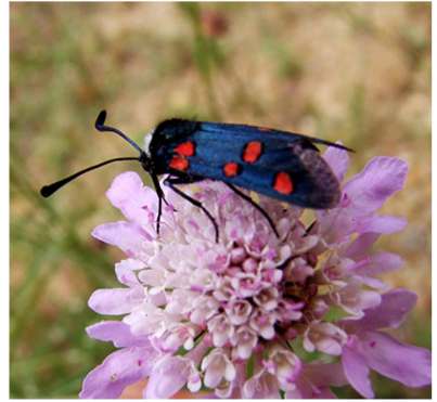
Zygaena lavandulae sur Scabiosa atropurpurea