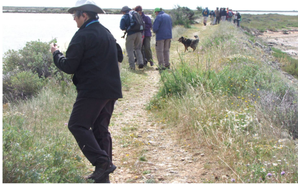
Sansouire : Digue

Anthemis maritima Aristolochia clematitis Arthrocnemum macrostachyum Asparagus acutifolius Atriplex halimus Beta vulgaris subsp. maritima Bituminaria bituminosa Cakile maritima Carduus pycnocephalus Carduus tenuiflorus Centaurea aspera Centaureum tenuiflorum Cirsium tenuiflorus Cirsium vulgare subsp. crinitum Clematis flammula Cneorum tricoccon Crithmum maritimum Cynoglossum creticum Diploaxis tenuifolia Echium angustifolium Eryngium campestre Eryngium maritimum Euphorbia characias Euphorbia paralias Euphorbia segetalis Frankenia hirsuta Halimione portulacoides Lepidium graminifolium Limoniastrum monopetalum Limonium virgatum Lobularia maritima Medicago littoralis Ononis minutissima Pallenis spinosa Phillyrea media Plantago albicans Plantago coronopus Psilurus incurvus Puccinellia festuciformis Rapistrum rugosum Reseda alba Rhamnus alaternus Rubus ulmifolius Sarcocornia perennis Scabiosa atropurpurea (= Sixalix atropurpurea subsp. maritima )