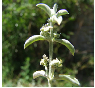
Mercurialis tomentosa - mâle