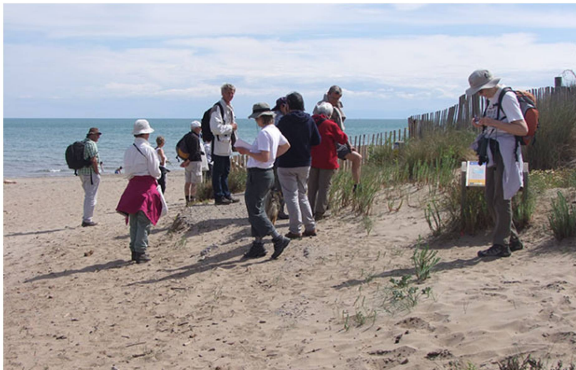
Embouchure de l'Aude

Echinophora spinosa Eryngium maritimum Euphorbia paralias Glaucium flavum Hordeum murinum Juncus acutus Linaria repens Lobularia maritima Matthiola sinuata Medicago marina Melilotus albus Pancreatium maritimum Paronychia argentea Picris echioides Plantago coronopus Plantago lanceolata Polygonum maritimum Raphanus raphanistrum Rubia tinctorum Scabiosa atropurpurea (= Sisalix atropurpurea subsp. maritima ) Silybum marianum Suaeda splendens Tribulus terrestris Xanthium strumarium