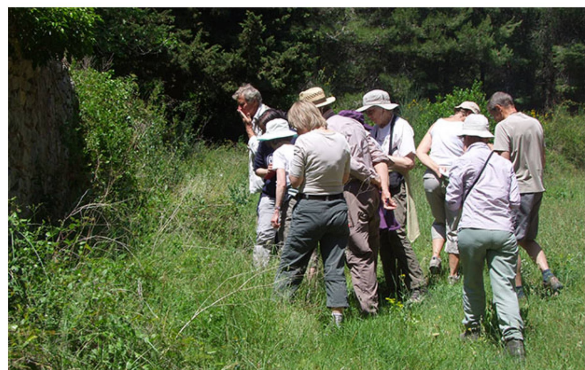
Champ près de l'ancienne pépinière

Coronilla valentina subsp. glauca Galactites tomentosus Kickxia commutata Linum bienne Linum narbonense Lotus dorycnium (= Dorycnium pentaphyllum ) Lotus hirsutus (= Dorycnium hirsutum ) Mercurialis tomentosa Ophrys apifera Populus nigra Salvia verbenaca Scabiosa atropurpurea (= Sixalix atropurpurea subsp. maritima ) Verbascum sinuatum