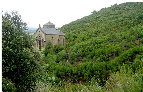
La chapelle Saint-Siméon

Aegilops ovata Ailanthus altissima Anagallis arvensis Arbutus unedo Aristolochia rotunda Asparagus acutifolius Asphodelus aestivus Asphodelus ramosus Asplenium adiantum-nigrum Asplenium trichomanes Bituminaria bituminosa Blackstonia perfoliata Bromus madritensis Bromus tectorum Bryonia dioica Bupleurum fruticosum Campanula rapunculus Catapodium rigidum