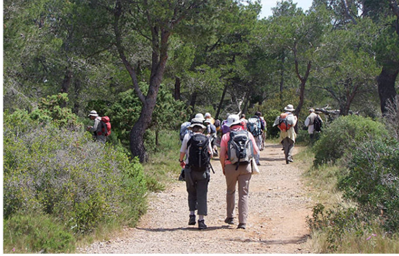
Sur le plateau de la Clape

Aphyllanthes monspeliensis Argyrolobium zanonii Aristolochia pistolochia Blackstonia perfoliata Brachypodium retusum Bufonia perennis Bupleurum semicompositum Centaurea corymbosa Centaurea solstitialis Cheirolophus intybaceus Cistus albidus Cistus monspeliensis Clematis flammula Cneorum tricocon Convolvulus lanuginosus Coronilla valentina subsp. glauca Cynoglossum creticum Dianthus pungens subsp. ruscinonensis Dipcadi serotinum Diplotaxis eruroides Dittrichia viscosa Echium vulgare Euphorbia exigua Ferula communis Galactites tomentosa Helianthemum violaceum Himantoglossum hircinum Hippocrepis comosa subsp. scorpioides Hormathophylla spinosa Hyoseris radiata Iris lutescens Juniperus oxycedrus Juniperus phoenicea Lactuca perennis Laurus nobilis Limodorum abortivum Linum strictum Lysimachia linum-stellatum (= Asterolinon linum-stellatum ) Melica sp. Myrtus communis Onobrychis saxatilis Ononis minutissima Osyris alba Phagnalon sordidum Phlomis lychnitis