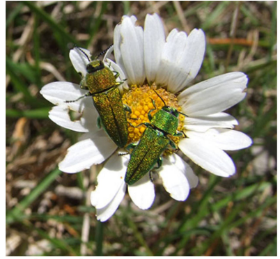
Anthaxia hungarica sur Helianthemum apenninum