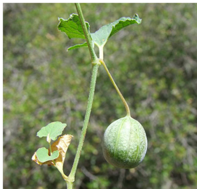
Aristolochia pistlochhia - Fruit