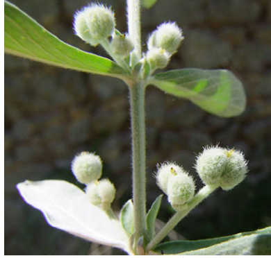
Mercurialis tomentosa - femelle