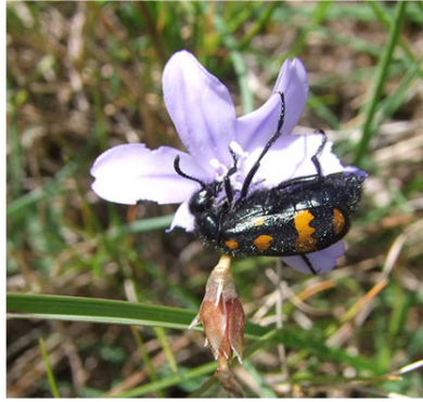
Milabris sur Aphyllanthes monspeliensis