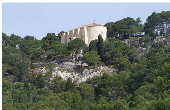
Plateau de la Clape : Chapelle Notre Dame des Auzils

Ajuga iva Arundo donax Asparagus acutifolius Bituminaria bituminosa Bupleurum fruticosum Campanula erinus Centranthus calcitrapae Crataegus azarolus Cupressus sempervirens Daphne gnidium Echium plantagineum Euphorbia segetalis Euphorbia serrata Fumana ericoides Galium sp. Geranium rotundifolium Linum strictum Lonicera implexa Myrtus communis Ononis minutissima Osyris alba Phillyrea angustifolia Phillyrea latifolia Phlomis lychnitis