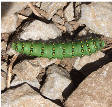
Chenille d' Eudia pavonia