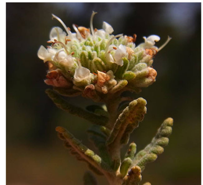
Teucrium polium subsp. clapae