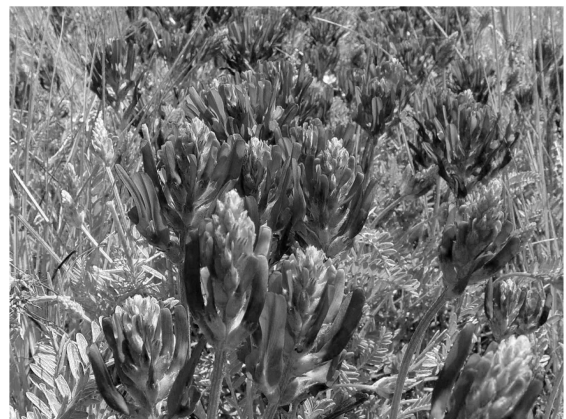
Astragalus cf onobrychis