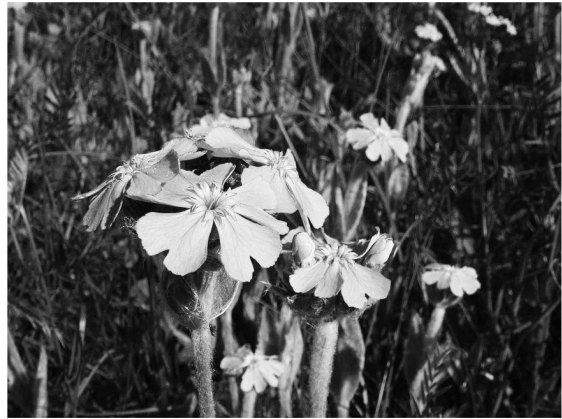
Lychnis flos-jovis Découverte