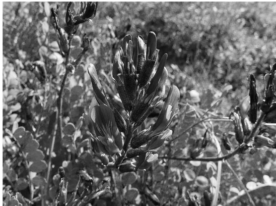
Astragalus cf monspessulanus

Le bilan du week-end est très positif, la liste des plantes est impressionnante et nous avons tous envie de revenir herboriser sous le soleil de Maurienne. Ce week-end se termine par un dernier verre avant de quitter à regret ce petit paradis, un grand merci à nos guides.