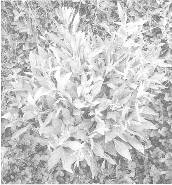
Figure 3. La centaurée jacée ( Centaurea jacea L., ici un pied non fleuri), une espèce bioindicatrice de la pollution à l'ozone.

ou élevées de polluant (fig. 4), que seule une infime quantité d'individus nécrosés subsiste dans des populations d'espèces reconnues pour leur forte sensibilité à l'ozone (trèfles et la plupart des représentants des légumineuses). Dans le cas de la centaurée, on observe, au contraire, un plus grand nombre d'individus nécrosés que d'individus résistants dans ces zones.