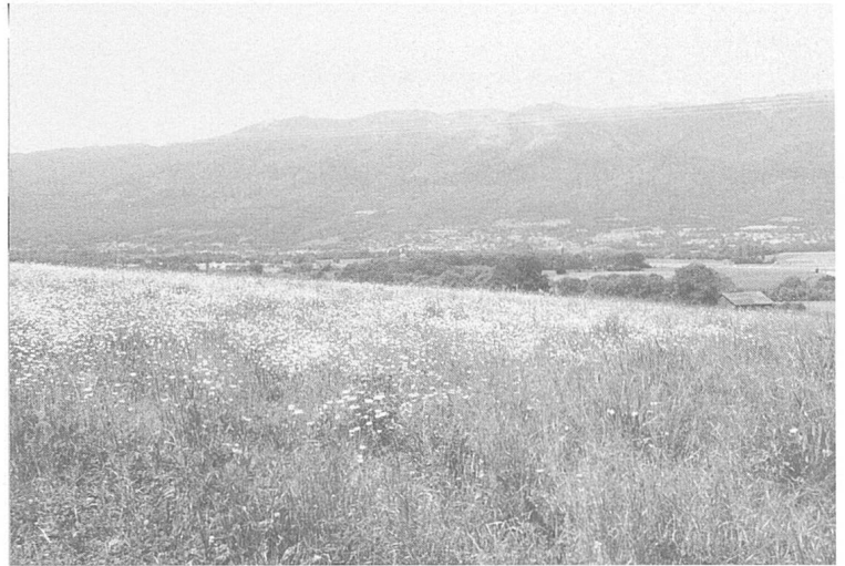
Figure 4. Une des surfaces de compensation écologique (jachère florale) à Genève (ici la région meyrinoise) et qui contient une forte densité d'individus de Centaurea jacea nécrosés par la pollution à l'ozone.

C'est suite aux observations décrites ci-dessus que la Suisse a été mandatée par le Programme PIC-Végétation pour développer des clones de Centaurea jacea sensibles et résistants à la l'o-