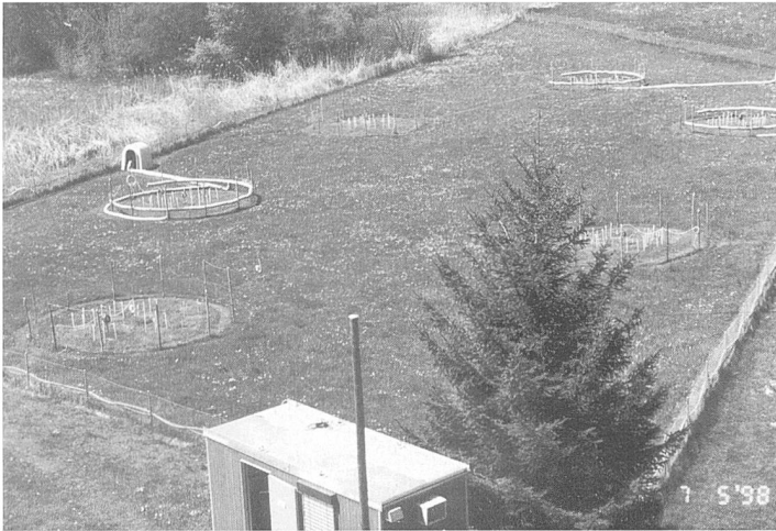
Figure 2. La participation suisse au projet européen de recherche BIOSTRESS (adresse internet : http://www.uni-hohenheim.de/biostress/web_swiss/ ) vise à mieux évaluer les impacts de la pollution à l'ozone sur la diversité végétale des prairies naturelles in situ (en photo : vue du site expérimental en Gruyère fribourgeoise).

espèces. Soit, en un mot, un changement potentiel de la biodiversité de ces communautés.