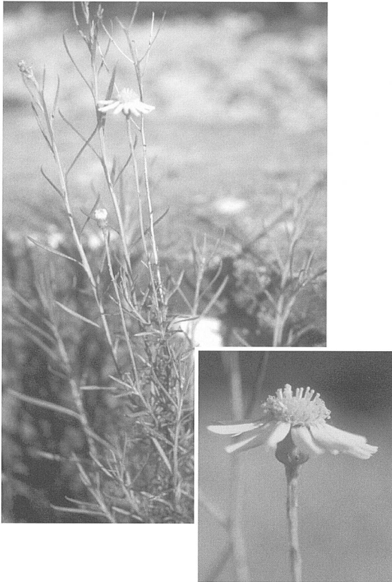
Figure 2. Le séneçon du Cap dans les graviers de la gare de Denges (juin 1996).

1989), peut-elle galoper si vite? Faut-il la craindre après l'avoir admirée? Y a-t-il ainsi beaucoup d'espèces qui apparaissent "spontanément"?