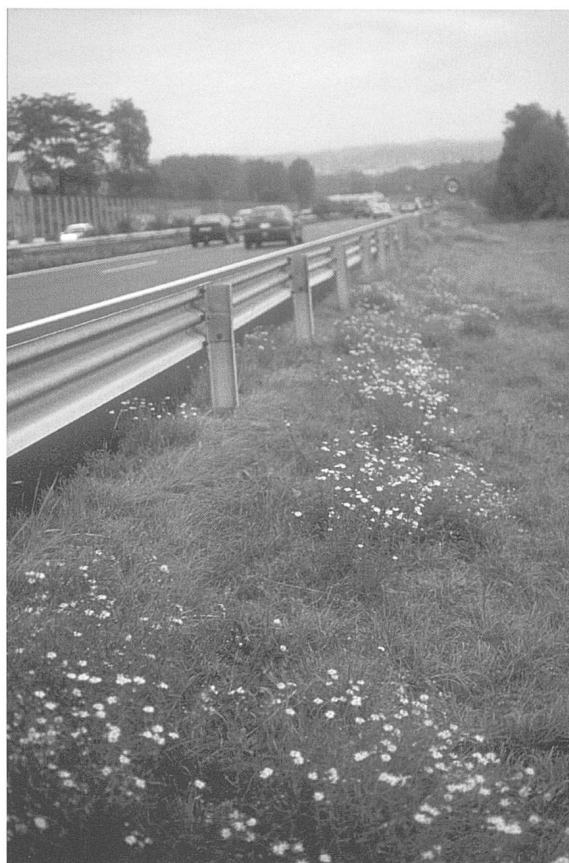
Figure 3. Touffe de séneçon du Cap sur le talus de l'autoroute près de Denges (octobre 1999).

b) le séneçon du Cap se contente d'un sol pauvre, par exemple graveleux et sec, condition dédaignée par la plupart des autres espèces mais