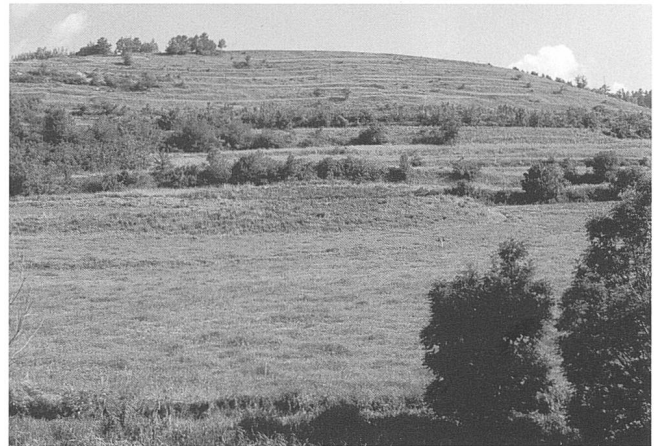
Figures 12 et 13.