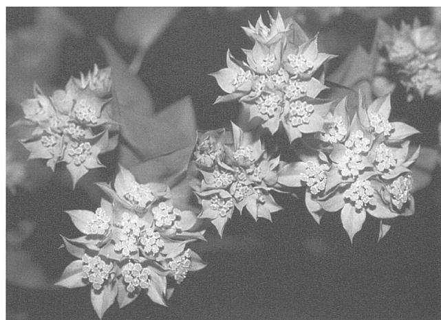
Figure 6. Buplèvre à feuilles rondes ( Bupleurum rotundifolium ), Isérables.