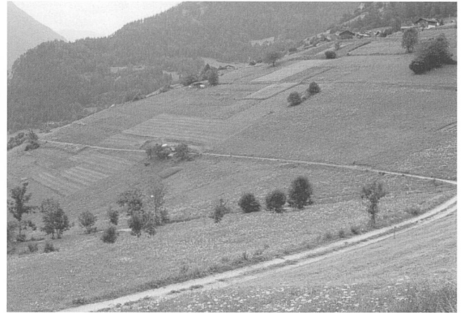
Figures 10 et 11.