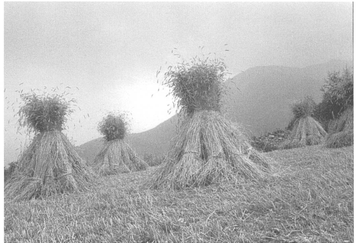
Figure 4. Unterems près de Tourtemagne, 1986 : cette vue appartient au passé, comme la variété locale de seigle qui atteignait la hauteur d'un homme.

Les céréales constituèrent une base importante de l'alimentation en Valais dès les débuts de l'agriculture, à l'époque néolithique. Dans la région, l'apparition des céréales remonte à près de 7 000 ans ; c'est ce que montre l'analyse des pollens dans les sédiments du lac de Montorge près de Sion (Welten, 1982). Jusqu'au début du xx e siècle, chaque village vivait en quasi-autarcie et disposait d'un ou plusieurs secteurs de champs en terrasses. Ils occupaient habituellement les surfaces les moins favorables aux herbages, autrement dit les terrains secs, caillouteux ou difficiles à irriguer par bisses.