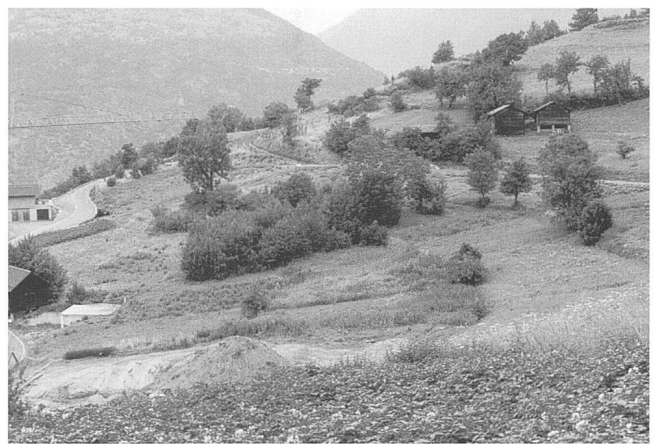
Figures 14 et 15.

Figures 10 à 15. Trois exemples de transformation du paysage entre 1986 (figures de gauche) et 2000 (figures de droite): des prairies artificielles ont remplacé les céréales, en partie grâce aux jets qui permettent d'arroser partout. Figures 10 et 11: le Levron près de Verbier. Figures 12 et 13: Lens sous Crans-Montana. Figure 14 et 15: Ergisch sur Tourtemagne.