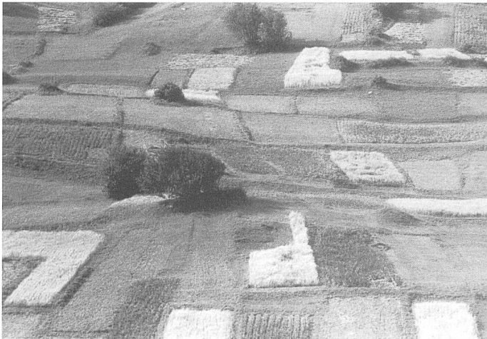
Figure 2. Haute vallée de Conches : céréales et pommes de terre alternent dans de minuscules parcelles. Pour combien de temps encore ?

couleur, mais aussi par les innombrables terrasses dont le modelé se devine encore sous les prairies et friches d'aujourd'hui. A la contribution paysagère s'ajoute le riche héritage d'une flore compagne spécialisée. Les agronomes parlent de plantes adventices. Quelques-unes sont envahissantes et qualifiées de « mauvaises herbes ». Bien d'autres sont rares et méconnues, en manque de protection (Werner, 1988, 1997).