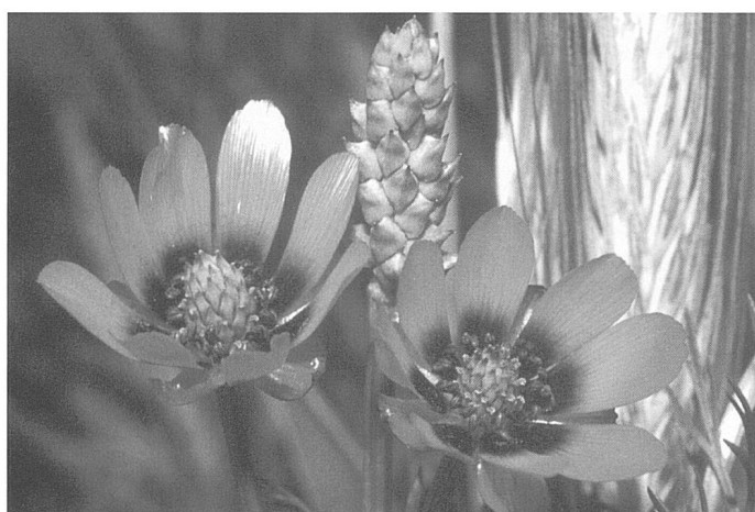
Figure 5. Adonis d'été ( Adonis aestivalis ), Sembrancher.