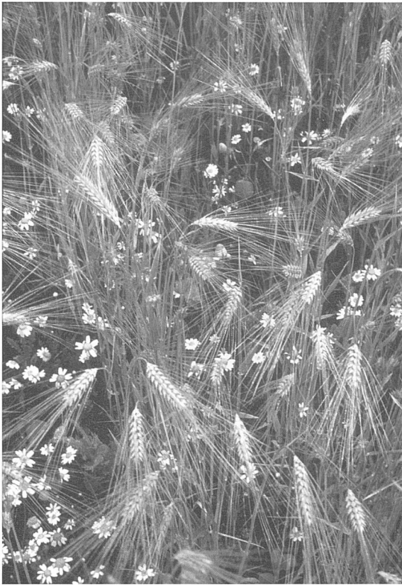
Figure 3. Loèche : sous les épis, un fond coloré de bleuets, de coquelicots, d'anémis des champs et autres adventices rares.

tices rares, qui n'ont pas eu la possibilité, ni le temps de s'adapter au nouveau rythme. En Valais, l'orge et l'avoine sont semés plutôt au printemps, le seigle et le triticale (hybride de blé et de seigle créé récemment) en automne.