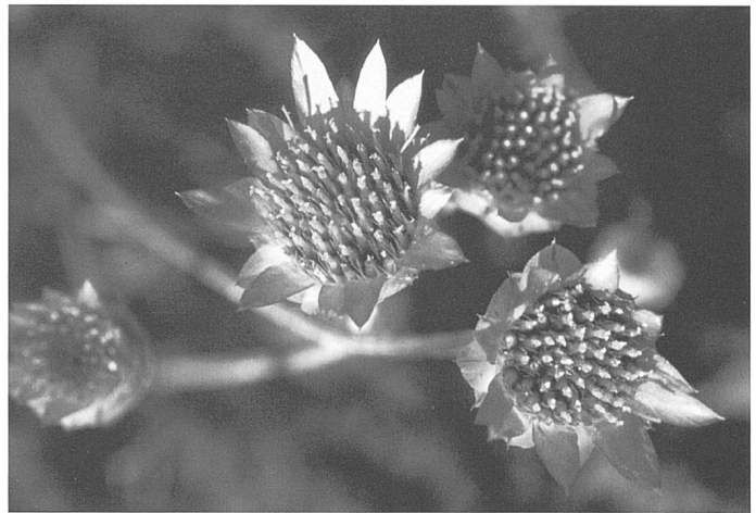
Figure 8. Xéranthème fermé ( Xeranthemum inapertum ), Loèche.

lors de la remise en culture de terrasses abandonnées. Il y a quelques exceptions, par exemple la nielle des blés ( Agrostemma githago ) qui s'est spécialisée au point de copier la céréale sur tous les aspects : cycle de croissance, époque de maturité, hauteur de la tige, grosseur de la graine. Elle dépend de l'homme pour sa survie, car ses graines ont une capacité de dispersion très réduite et une viabilité limitée à 1-2 ans. La mécanisation des moissons et du tri des semences explique son recul dramatique au niveau cantonal et européen.