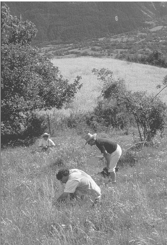
Figure 16. Loèche : Catherine Lambelet (au fond) et ses aides prélèvent un échantillon des adventices les plus menacées pour la nouvelle « banque de graines » des Conservatoire et Jardin botaniques de la Ville de Genève.

6. Sites de multiplication : des passionnés (fig. 17) ont mis sur pied dans des terrasses abandonnées de véritables « jardins botaniques » axés sur la conservation des vieilles variétés de céréales et des adventices rares. L'offre touristique s'élargit. Les visiteurs sont invités à participer à des excursions guidées et parfois aussi