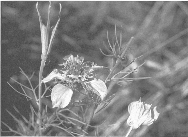
Figure 7. Nigelle ( Nigella arvensis ), Loèche.