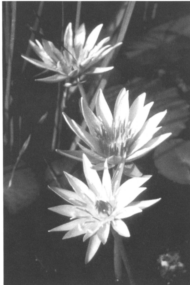
Figure 13. Nymphaea capensis

Sans présager du futur, ni entrer dans le débat de savoir si la classification doit nécessairement