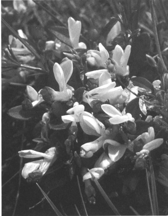
Figure 11. Polygala chamaebuxus

1. La traditionnelle stricte séparation entre Monocotylédones et Dicotylédones (les deux classes des Liliopsida et Magnoliopsida ) est partiellement remise en question. Si les Monocotylédones sont effectivement monophylétiques, les Dicotylédones ne le sont pas. De fait, il faut distinguer dans ce dernier groupe les vraies Dicotylédones (ou Eudicotylédones) monophylétiques, d'un groupe qui se révèle ancestral aux Monocotylédones (et peut-être aussi aux Eudicotylédones, mais les résultats à ce sujet varient selon les gènes analysés): ce sont les Paléohérbes et Paléoarbres. Ces plantes ont généralement deux cotylédons, mais des fleurs, soit très petites et apétales, soit très grandes avec, généralement, de nombreux pétales en insertion spiralée. On y trouve, notamment, les Illiciacées, Magnoliacées, Lauracées et autres familles proches (Paléoarbres ou complexe magnolidien), ainsi que les Nymphéacées, Piperacées, etc. (Paléohérbes). On remarquera que ces ex-Dicotylédones nous posaient souvent des problèmes quant à leurs caractéristiques morphologiques: elles présentent toutes un pollen à un seul pore (une caracté-