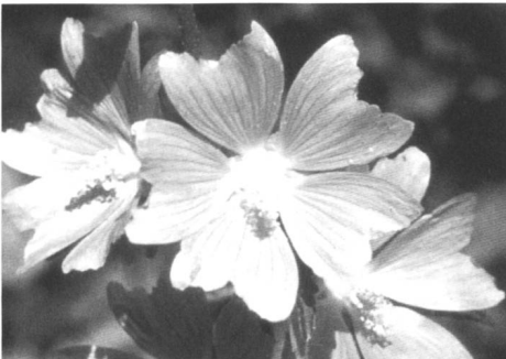
Figures 4. Fleurs de tilleul ( Tilia spp.)