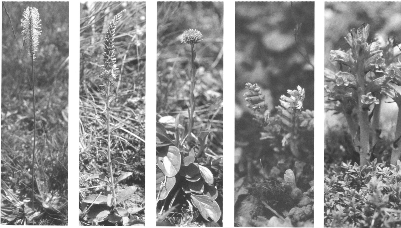
Figures 6 - 10

6. Plantago media , 7. Veronica spicata , 8. Globularia bisnagarica , 9. Lathraea squamaria et 10. Orobanche alba