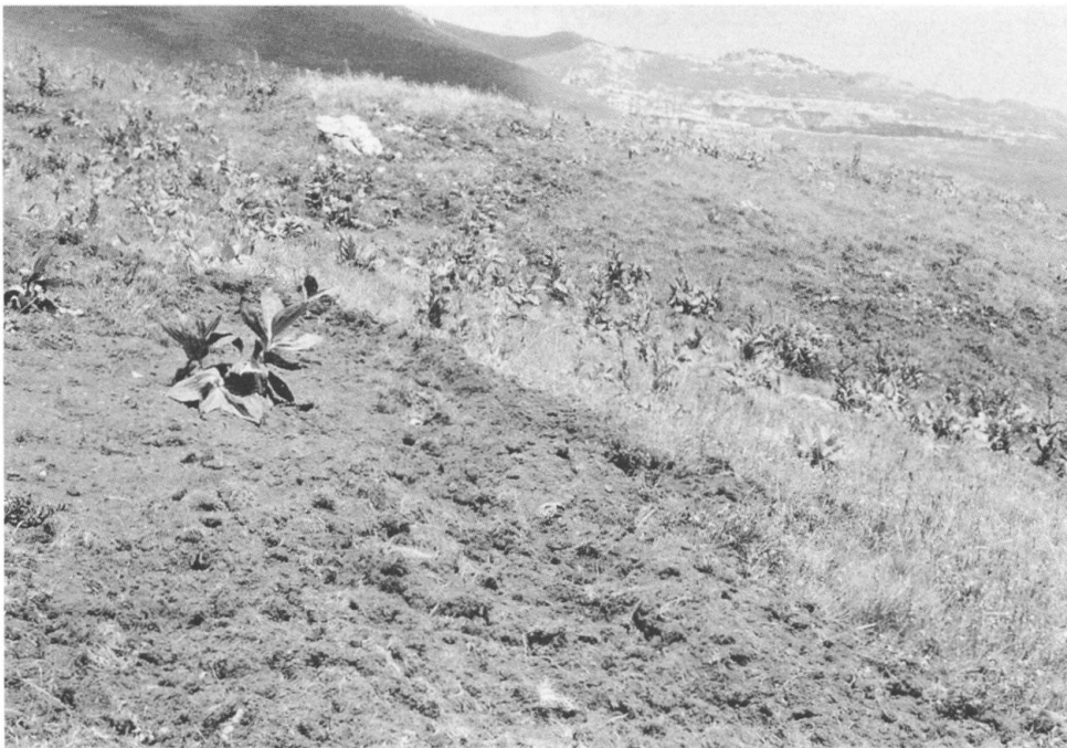
Photo II. – Paysage végétal des pelouses neutro-basophiles sur marno-calcaires substructuraux ( Plantagini-Cariceto: sigmetum , sigma-relevé type n° 1 dans le tableau II). Au premier plan: rajeunissement des versants par les sangliers dans le Scillo-Poetum (17) et le Nardetum jurassicum violetosum (18); été 1994.