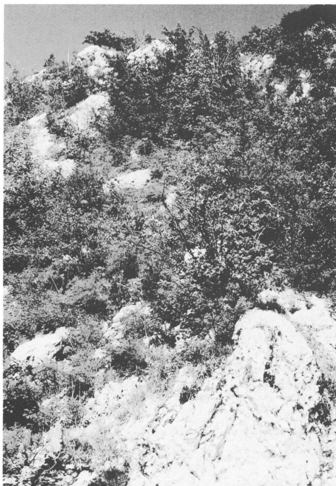
Photo III. – Paysage végétal spécialisé des versants calcaires chauds et instables du Jura. Grande biodiversité. Végétation primaire de sermontains et de nerpruns des Alpes (en montant le sentier de Narderan, alt. 1310 m). Sigmarelevé type n° 1 du tableau III.

veau type de paysage, ce sont donc bien la pluripotentialité, la variété des structures végétales mais aussi l'absence d'une série de végétation correspondant à une association climacique qui font en quelque sorte la différence avec les paysages de la phase sériale initiale (tableaux I et II).