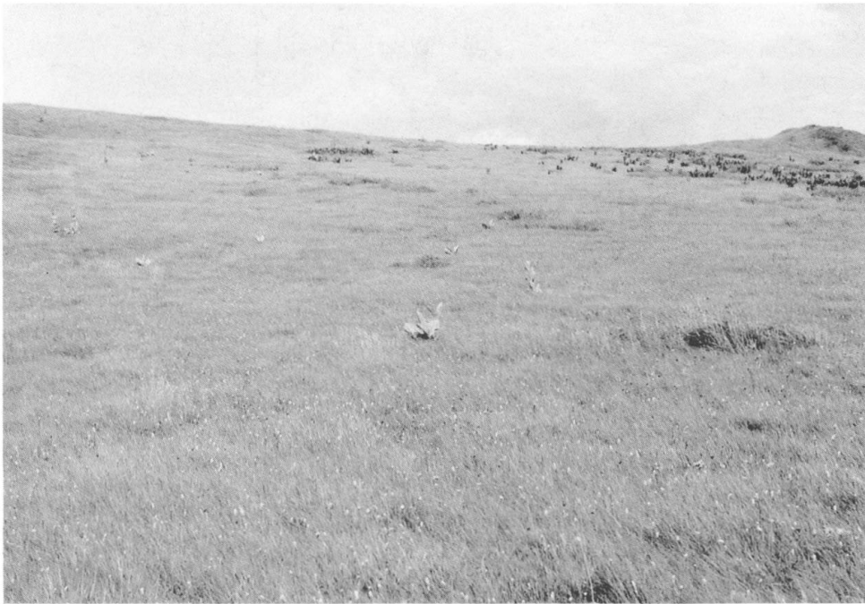
Photo I. – Paysage végétal des sommets marno-calcaires du Jura. “Les Herbes plates”, haut plateau au-dessus de La Chaz (Reculet), près du pt. 1692. Prairie à koelerie et luzule ( Luzulo-Koelerietum (15) du sigma-relevé type n° 1, tableau I. Les numéros entre parenthèses suivant le nom des associations végétales correspondent à ceux de la légende de la carte phytosociologique au 1:5000 (op. cit.).