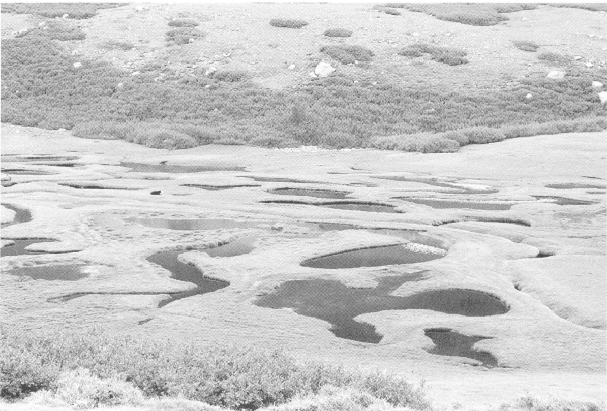
Fig. 4. — Le magnifique plateau des Pozzi au pied du Renosu.

Puis près des bergeries des Pozzi (1740 m), nous traversons une aulnaie odorante de zones ruisselantes ( Alnetum suaveolentis peucedanetosum ) dans le vallon du ruisseau avec: