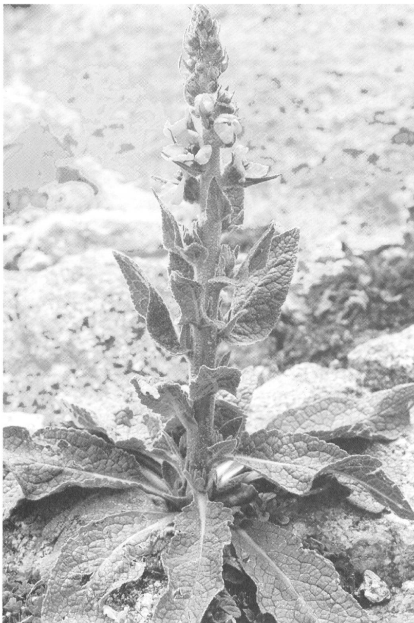
Fig. 5. — Verbascum conocarpum subsp. conradiae dans les éboulis du Monte d'Oro à 2000 m.

– Ceterach officinarum , * Cymbalaria hepaticifolia , Helichrysum italicum subsp. italicum , Hypochaeris achyrophorus .