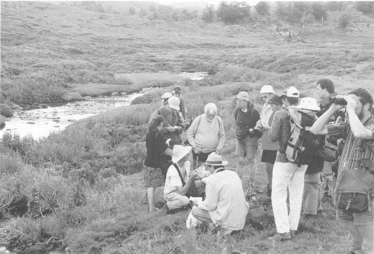
Fig. 3. — Sur le Coscione, dans les pozzines du ruisseau de Veracolngu.

– Ranunculus flammula , Carex echinata , C. ovalis (= C. leporina auct.), Isolepis setacea , ** Thlaspi brevistylum , ** Saponaria ocymoides subsp. alsinoides , ** Luzula spicata subsp. italica , Hieracium pilosella , ** Potentilla rupestris var. pygmaea , * Potentilla anglica subsp. nesogenes , Epilobium anagallidifolium , Carex viridula subsp. viridula (= C. serotina auct.), Juncus effusus , * J. requienii , *° Mentha requienii , Cynosurus cristatus , ** Scrophularia cf. oblongifolia .