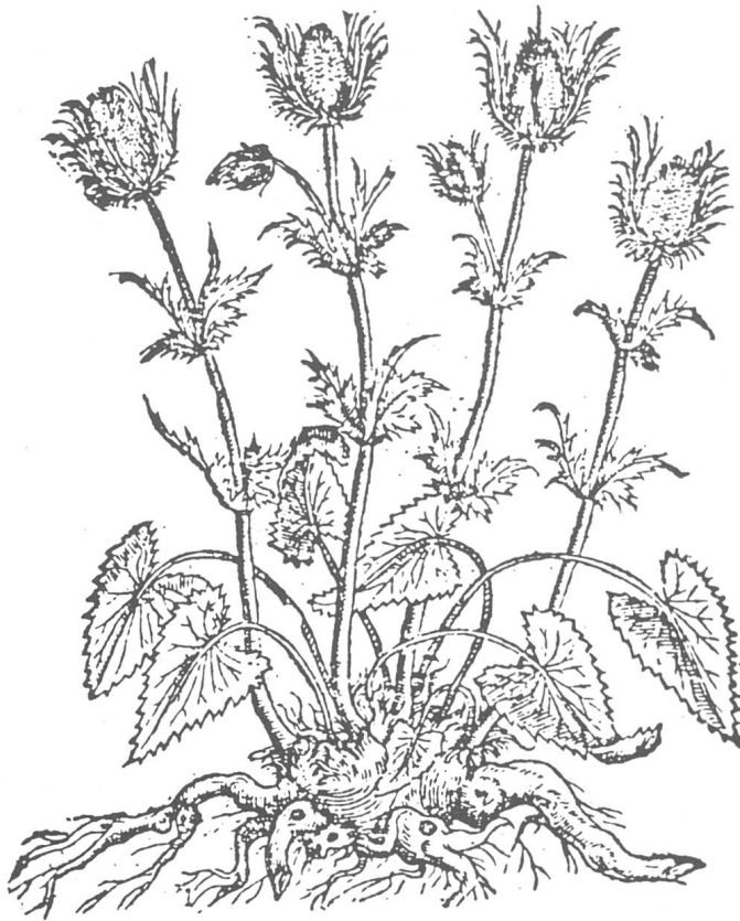
Fig. 1. — Le chardon bleu des Alpes ( Eryngium alpinum ), tel qu'il est figuré dans l'ouvrage de PENA & DE L'OBEL (1570).

paradoxe est en fait révélateur d'une caractéristique remarquable du Jura gessien, à savoir la présence sur ses hauteurs de nombreuses espèces alpines.