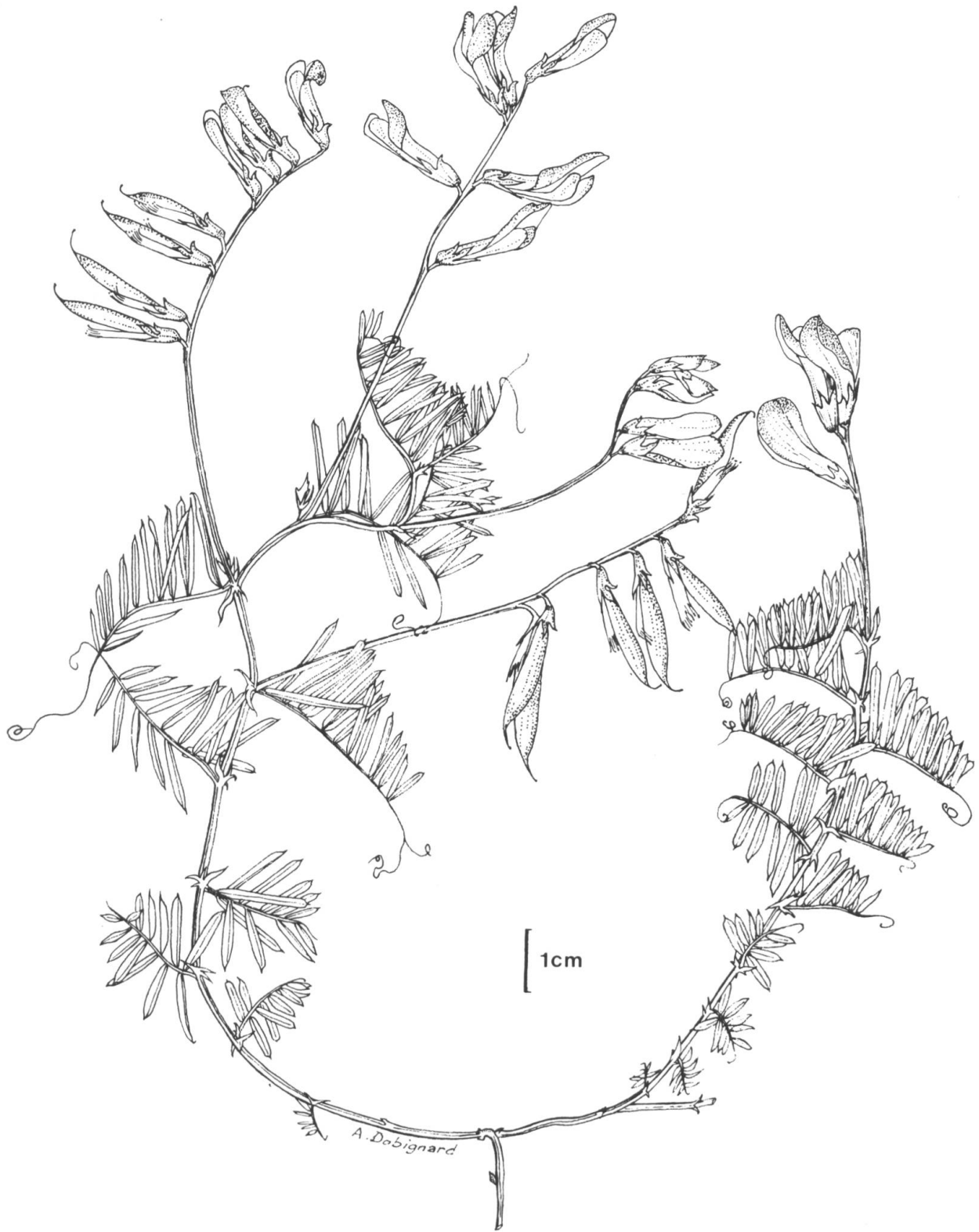
Fig. 2. — Vicia onobrychioides L. subsp. alborosea Dobignard.