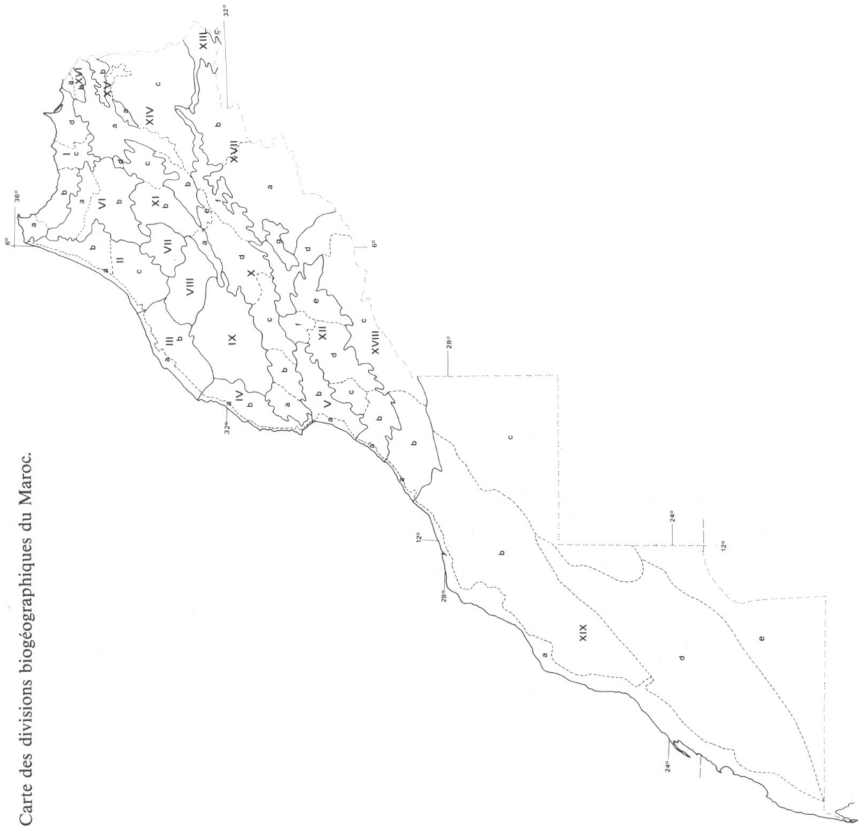
Fig. 1. — Carte des divisions biogéographiques du Maroc.