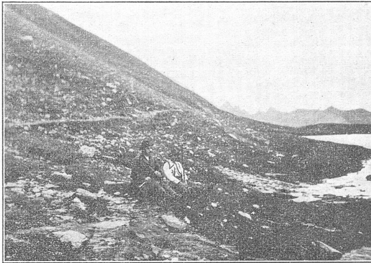
Phot. E. Th. 9. 7. 31

du bord occidental du Lac Egourgéou, éboulis (fig. 2), TB 9.7.31.