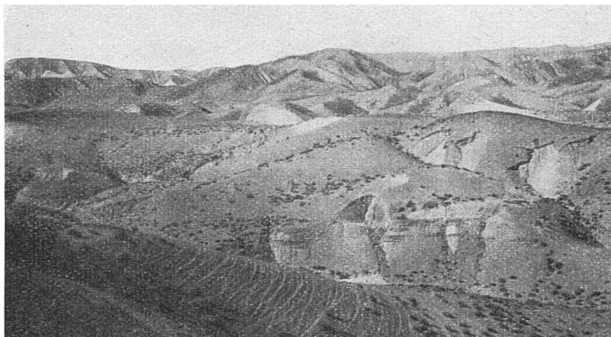
Fig. 1. — Désert de Judée.

nous avons déjà étudiées à fond dans notre étude sur le « Wasserhaushalt » de quelques plantes typiques de ce désert (3). Ainsi nous avons l'avantage de connaître exactement tous les facteurs météorologiques, car nous avons, dans le but de mesurer la transpiration, visité ces deux territoires un ou deux jours par mois durant une année, et y avons mesuré ces facteurs dans leur marche journalière. Nous connaissons pour ainsi dire à fond, chaque centimètre carré de ces territoires, il était donc tout indiqué de les choisir pour nos études du sol.