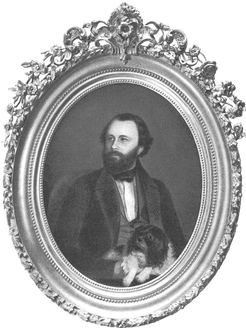
Edmond Boissier vers 1860 d'après un pastel de Durand (Manoir de Valleyres)