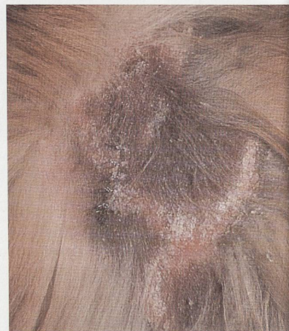
Oberflächliche Pyodermie/Pyodermie superficielle Etiderm