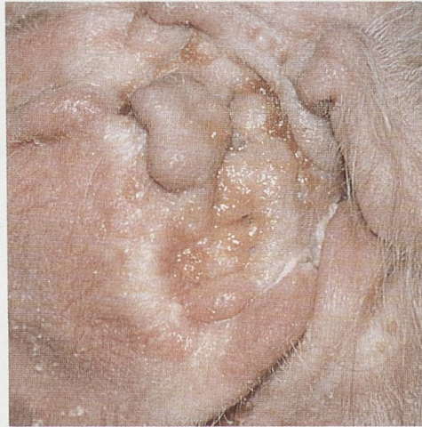
Chronische Otitis/Otite chronique Epi-Otic