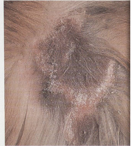
Oberflächliche Pyodermie/Pyodermie superficielle Etiderm