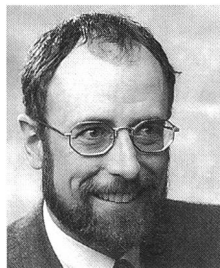
Gesellschaft Schweizerischer Tierärzte

Das vorliegende Sonderheft des «Schweizer Archiv für Tierheilkunde» wird, wie die Sponsorenliste zeigt, gemeinsam getragen von der Gesellschaft Schweizerischer Tierärzte GST, dem Bundesamt für Veterinärwesen BVET, den Kantonstierärzten, dem Schweizerischen Bauernverband SBV und anderen Sponsoren aus Produzenten- und Konsumentenkreisen. Die breit abgestützte Trägerschaft dokumentiert, dass alle Beteiligten am gleichen Strick zu ziehen bereit sind. Das Heft steht in engem Zusammenhang mit dem Verbot der antimikrobiellen Leistungsförderer (AML) und der ab 1.1.1999 (Übergangsfrist bis zum 30.6.99) geforderten Aufzeichnungspflicht für den therapeutischen Einsatz von Antibiotika. Es ist ein Teil des gemeinsamen Kommunikationskonzeptes zur positiven Umsetzung der Aufzeichnungspflicht. Wissenschaftliche Beiträge zur aktuellen Thematik und Hintergrundinformationen zum Standpunkt der Tierärzteschaft sollen den praktizierenden Tierärztinnen und Tierärzten gleichermaßen als Orientierungshilfe dienen, wie sie Politikerinnen und Politikern, Medienschaffenden, Produzentinnen und Produzenten als sachliche Wissensgrundlage zur Verfügung stehen. Wir wollen in diesem Heft die Problematik «Verzicht ja – aber» beleuchten und den Weg aufzeigen, der im Sinne der öffentlichen Gesundheit zum Ziel führt. Wir setzen uns ein für gesunde Tiere und damit einwandfreie Lebensmittel in Verantwortung gegenüber Tier, Mensch und Umwelt.